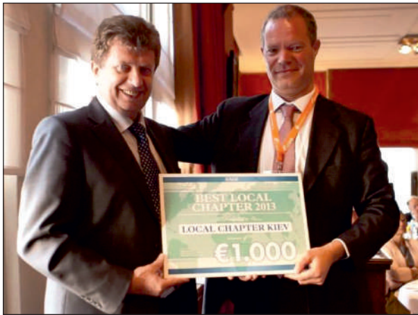
Київський осередок EAGE вдруге визнано найкращим (2014 р.)

підсумками конкурсу серед 19 місцевих осередків український знову було визнано найкращим і відзначено врученням відповідного сертифіката.