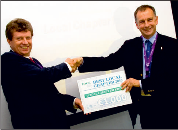
Вручення сертифіката Київському осередку EAGE на конференції у 2011 р.