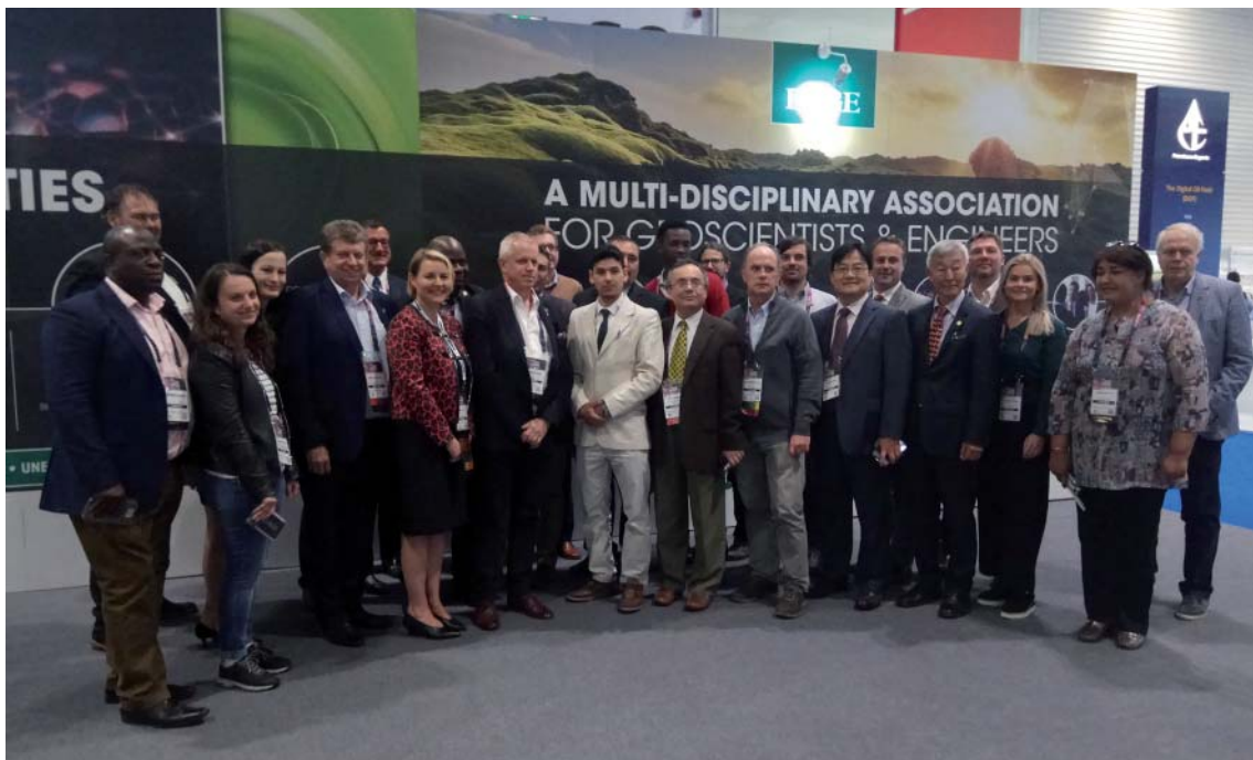
Керівництво EAGE з керівниками асоціацій різних країн, учасниць виставки та конференції в Лондоні, 2019

Починаючи з 2000 р. представники Центру були учасниками майже всіх конференцій та технічних виставок, які щорічно проводить EAGE (Європейська асоціація геовчених та інженерів, м. Хоутен, Нідерланди). EAGE стала надійним міжнародним партнером Центру і ВАГ. Від 2011 р. конференція з геоінформатики в Україні має міжнародний статус і проводиться за повної підтримки EAGE. ВАГ є активним, щорічним учасником головної події в житті EAGE — щорічної виставки та конференції.