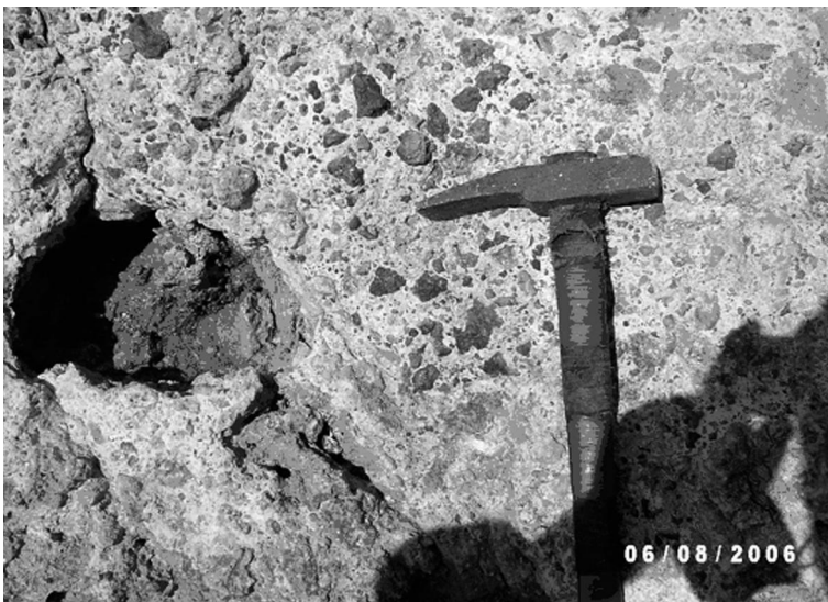
Рис. 4. Гераклиты угловатой и рвано-оскольчатой формы в брекчиевидных известняках. Буро-коричневые "стяжения" угловато-округлой формы, выполненные лимонитом и гидроокислами железа (возможно, фрагменты выветривания пиритовых построек неогена). Мыс Херсонес

Анализы газового состава выбросов грязевых вулканов суши часто содержат сероводород. Академик Е.Ф. Шнюков выдвинул гипотезу, что подпитка и образование сероводородной зоны в Черном море связаны с деятельностью грязевого вулканизма и сипов [24]. Глубинное происхождение сероводорода, послужившего причиной заражения моря, подтверждается его наличием во многих источниках Горного Крыма и в скважинах для водоснабжения, пробуренных в зонах разломов. Анализ воды из них характеризуется высокими содержаниями сероводорода, йода, брома и кремнезема. Породы водоносного горизонта и ниже залегающих слоев не содержат органики, а