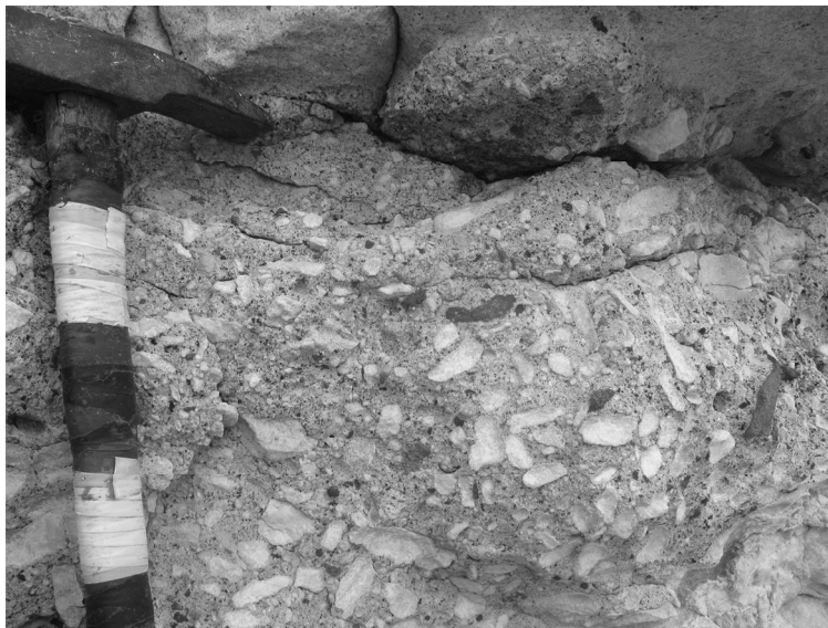
Рис. 1. Брекчиевидный известняк верхнего сармата с обломочным материалом гераклитов

При ударе и трении двух образцов гераклитов друг о друга появляется специфический запах углеводородов и битумов. Необходимо отметить, что при истирании мелкообломочного материала в порошок этот запах резко усиливается. Поровое пространство в гераклитах, согласно нашим исследованиям, заполнено метаном, углекислым газом, этаном, пропаном, азотом и сероводородом [14]. Эти газы являются прямыми признаками для поиска газонефтяных месторождений и подтверждают процессы глубокой дегазации в неогене. Эти данные и широкое распространение прослоев пород с герак-