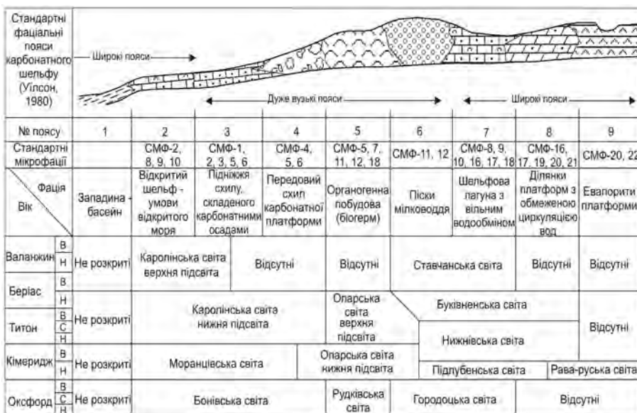
Рис. 1. Відклади верхньої юри–валанжину Передкарпаття відповідно до стандартних фаціальних поясів карбонатного шельфу (за О.В. Анікеєвою, 2005, зі змінами і доповненнями)

У басейні седиментації даного комплексу визначено зони формування відкладів відповідно до моделі розподілу стандартних фаціальних поясів карбонатного шельфу [Уилсон, 1980] (рис. 1).