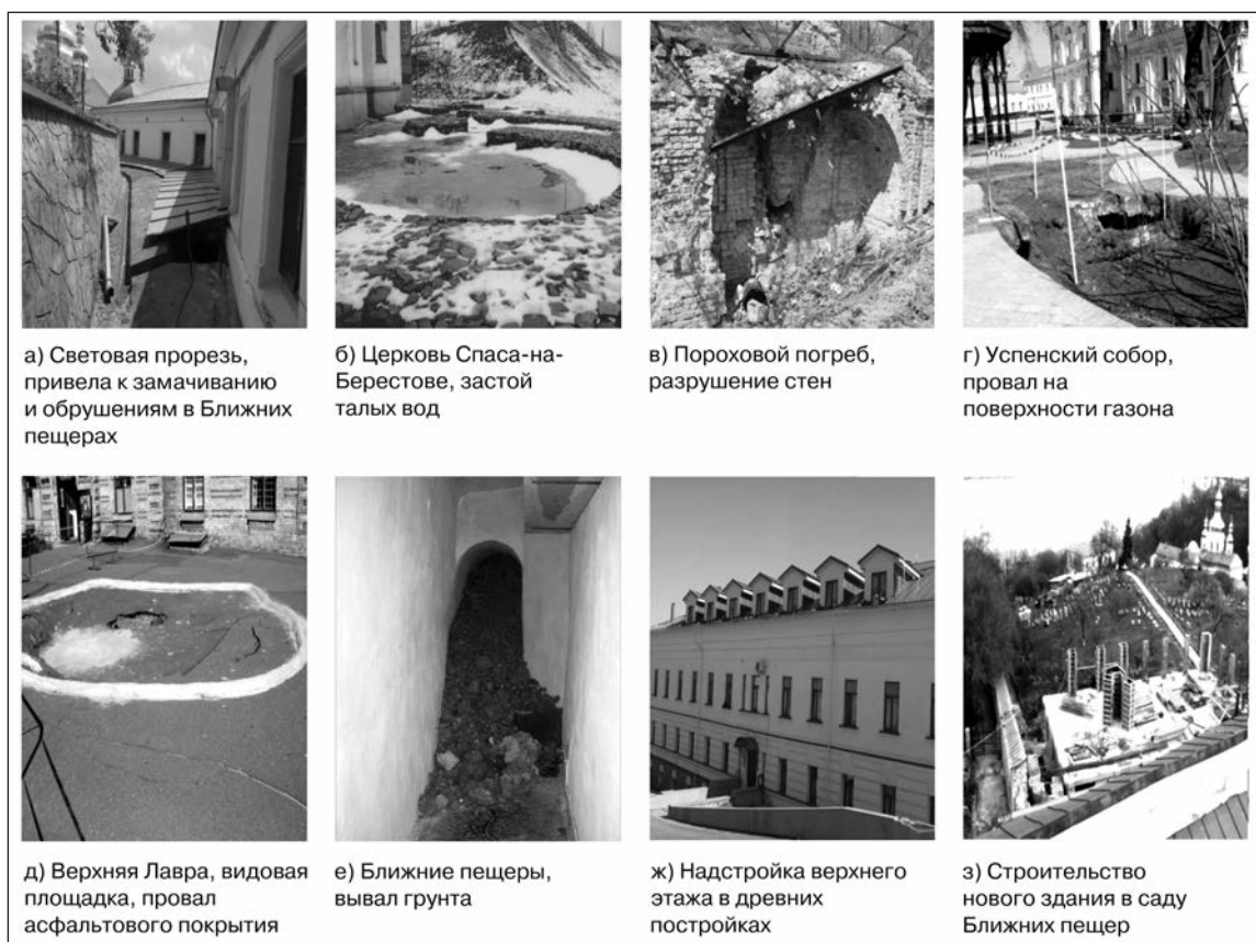
Рис. 1. Результаты техногенного воздействия на здания и сооружения Заповедника Fig. 1. Results of technogenic influence on buildings and structures the Reserve