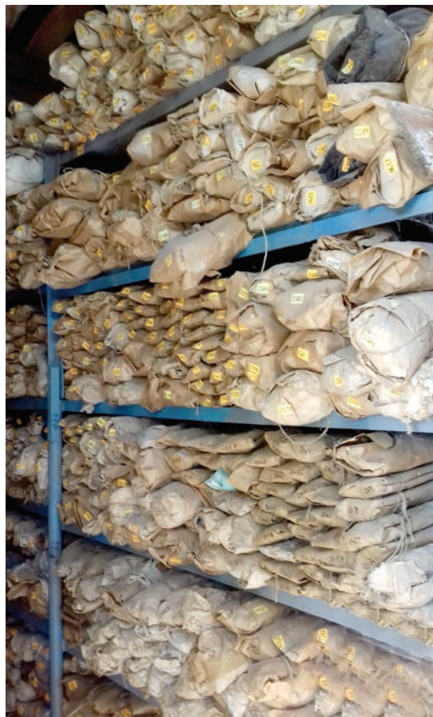
Рис. 3. Керносковище колонок морських осадів відділу сучасного морського седиментогенезу

– Розроблено концепцію морських геохімічних досліджень в Світовому океані, започатковано новий науковий напрям – морська геоecологія, засновано науковий журнал «Екологія довкілля» (засновник О.Ю. Митропольський).