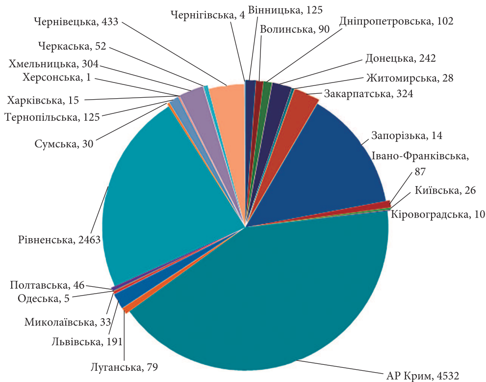
Рис. 2. Розподіл площі (га) геологічних об'єктів природно-заповідного фонду по областях (за даними Кадастру)