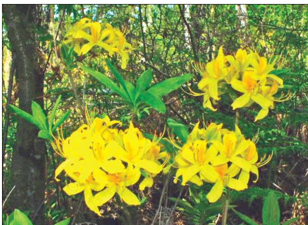
Рис. 4. Азалія понтійська (рододендрон жовтий — Rhododendron luteum Sweet) Fig. 4. Azalea Pontic (yellow rhododendron — Rhododendron luteum Sweet)

районів Польщі надати інформацію про стан природи і музеїв-пам'яток та розробити проект плану їх організації і розвитку. У 1928—1929 рр. він збирає матеріали та відвідує ряд польських музеїв. Результатом цієї роботи стає опублікована у 1930 р. праця «Про питання польської природничої та краєзнавчої музеєлогії».