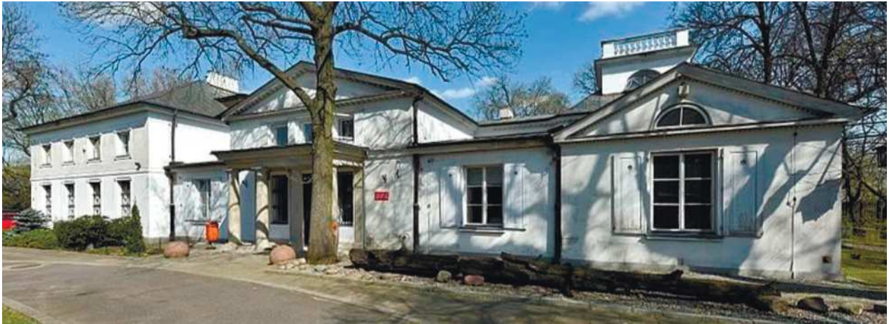
Рис. 1. Музей Землі, м. Варшава, Польща