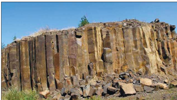
Рис. 2. Виходи базальтів у кар'єрі, с. Базальтове Fig. 2. Basalt outcrop in the quarry, Basaltove village