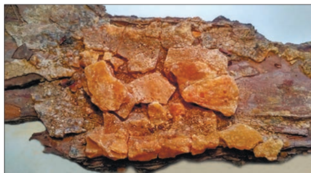
Рис. 1. Смоляні підкорові виділення. Fig. 1. Resin sub-rind secretions.

Для встановлення корінного першоджерела розсипів, яке пов'язано з фосилізацією рослинних смол, застосовано палеогеоморфоло-