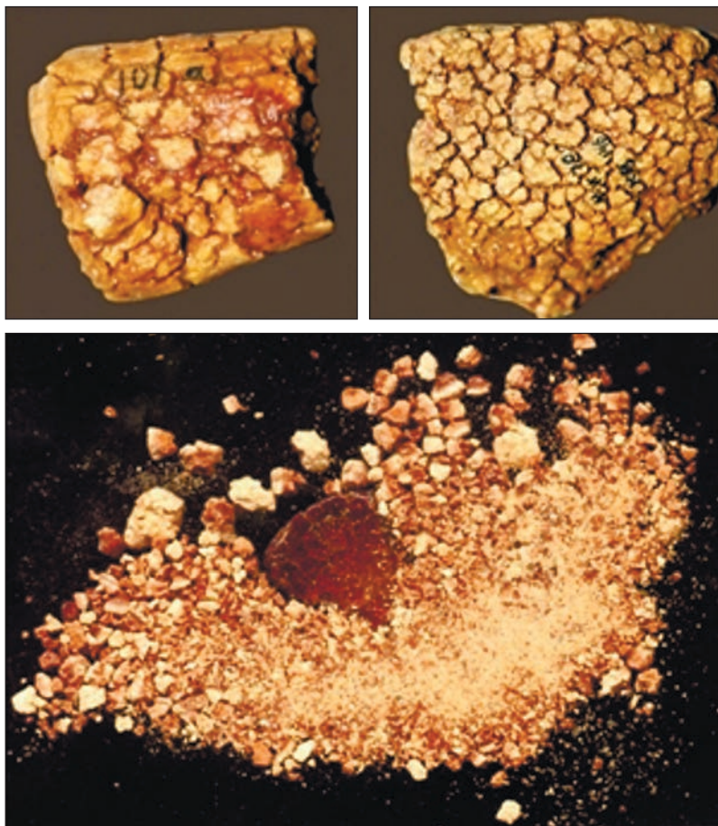
Рис. 5. Археологічний бурштин з поселення Межиріч.