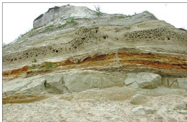
Рис. 4. Стратиграфічний розріз межигірської світи, с. Нові Петрівці, Київська область.

У пізньому еоцені збільшились обсяги розмивання протобурштину з біогенно-осадових покладів, накопичених протягом наземно-болотного етапу фосилізації рослинних смол. У результаті протобурштин, що частково осідав у береговій зоні, виносився в віддалені, більш глибокі частини морського шельфу. Детальне вивчення речовинного складу та аутигенного мінералоутворення продуктивного шару «блакитної землі» родовища Янтарного Калінінградської області (до 80 % світових запасів