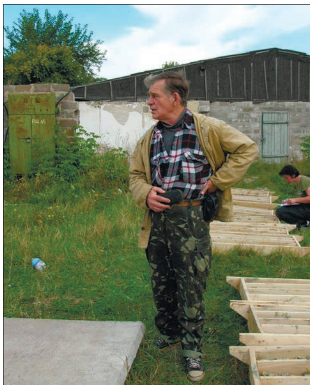
Геологічна екскурсія по заповіднику «Кам'яна Могила», Запорізька область, 2005 р.