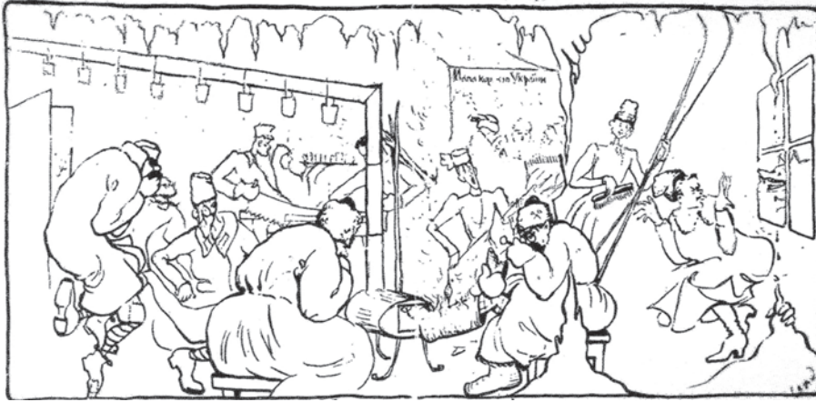
Малюнок-шарж В.В. Різниченка «Кабінетна праця геологів Українського геологічного комітету», 1922 р.

Drawing-cartoon of V.V. Riznychenko "Office work of geologists of the Ukrainian Geological Committee", 1922