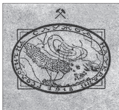
Емблема Українського геологічного комітету, 1918 р.