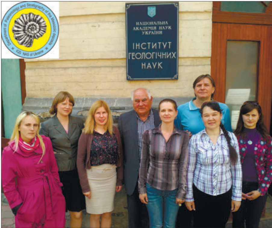
Співробітники відділу стратиграфії і палеонології мезозойських відкладів, травень 2016 р., Київ Staff of the Department of Stratigraphy and Paleontology of Mesozoic Sediments, May, 2016, Kyiv

Аналіз та узагальнення величезного масиву емпіричного матеріалу відображені у таких монографіях та препринтах: «Закономерности распространения фораминифер в Северной и Тропической Атлантике» (1977), «Кремнистые микроорганизмы и их использование для расчленения палеогеновых отложений Предкарпатья» (1977), «Биостратиграфическое обоснование границ в палеогене и неогене Украины» (1979), «Стратиграфическая схема палеогеновых отложений Украины» (1987), «Геология и металлогения юго-западной части Красного моря» (1988), «Литолого-стратиграфическая характеристика позднечетвертичных осадков на профиле материкового склона Гвинеи» (1990), «Условия формирования, состав и физические свойства донных отложений прибрежной части шельфа Гвинейской Республики» (1991), «Геологические и биотические события позднего еоцена — раннего олигоцена» (1996), «Atlas Peri-Tethys Paleogeographical Mets» (2000), «Палеогеновая спонгиофауна Восточно-Европейской платформы и сопредельных регионов» (2003), «Стратиграфія мезозойських відкладів північно-західного шельфу Чорного моря» (2006) та ін.