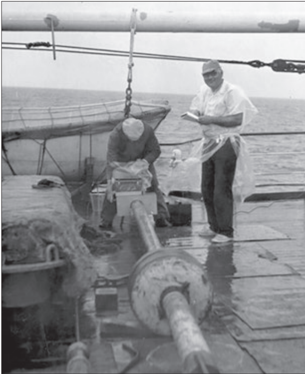
НДС «Михайло Ломоносов», 1970 р. «Mikhailo Lomonosov» research ship, 1970

УРСР (м. Івано-Франківськ) на посаді старшого геолога, старшого інженера-палеонтолога. Великим здобутком дослідника в той час було те, що він створив та очолив мікропалеонтологічну лабораторію в цій організації.