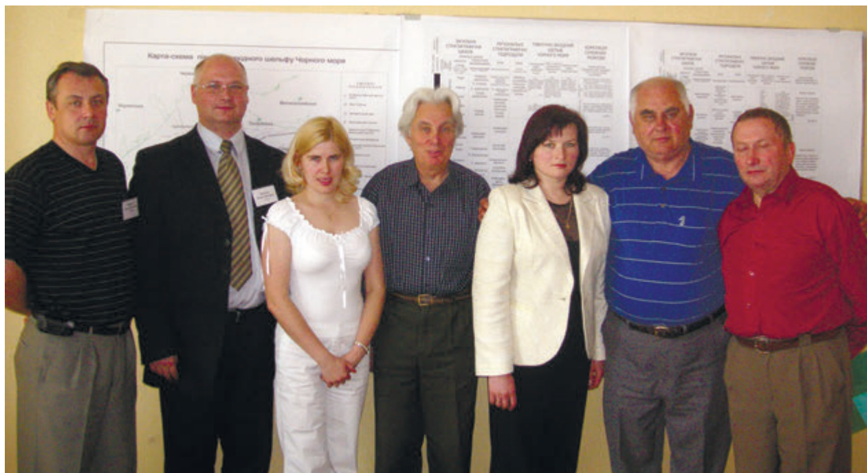
Учасники мезозойської комісії Національного стратиграфічного комітету України, травень 2006 р., Луганськ Participants of the Mesozoic Commission of the National Stratigraphic Committee of Ukraine, May 2006, Luhansk