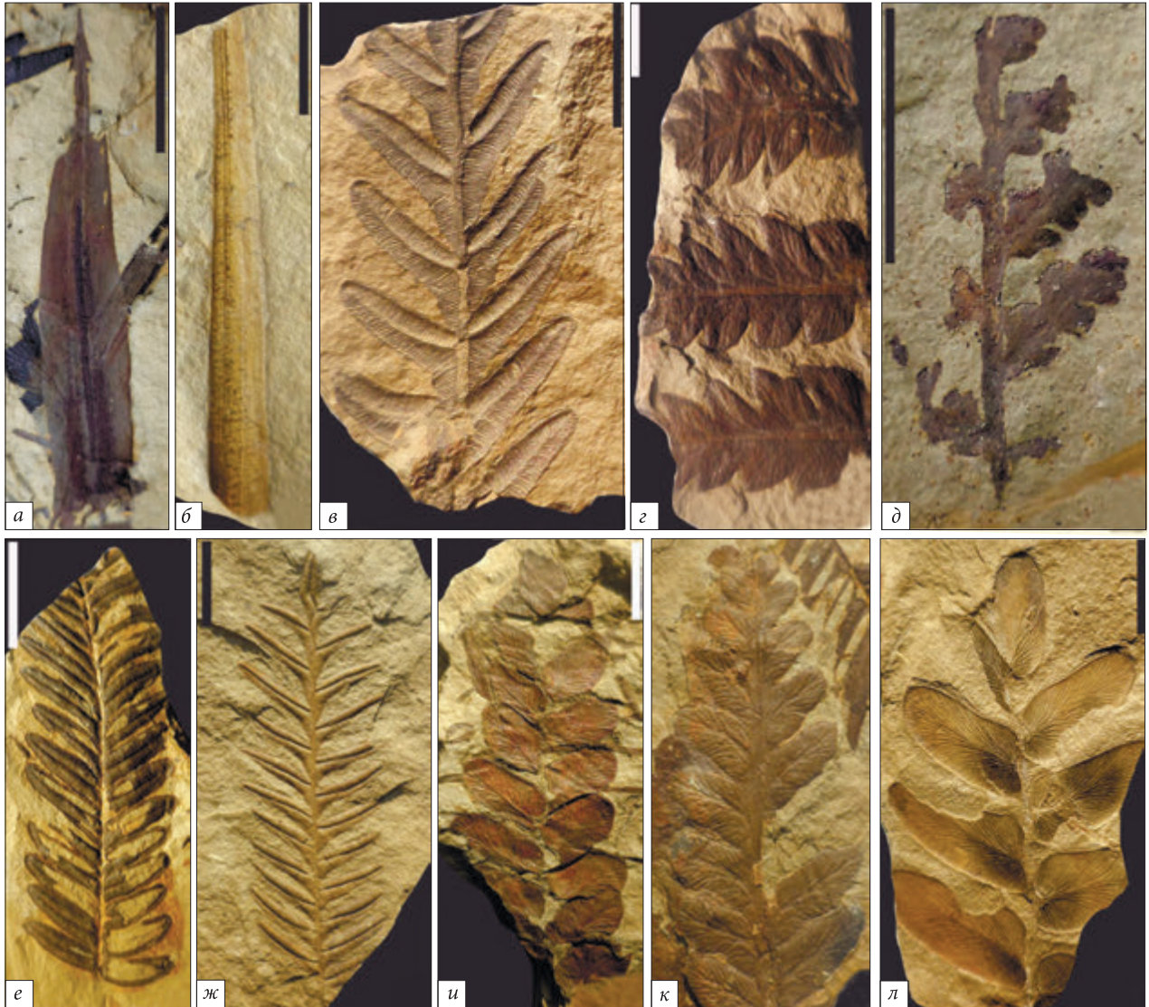
Рис. 5. Рештки деяких рослин з місцезнаходження Ровеньки: а — Lepidostrobophyllum lanceolatum (Lindley et Hutton) Bell (GMLNU-1/53); б — Cyperites bicarinatus Lindley et Hutton (GMLNU-1/22); в, ж — Alethopteris decurrens (Artis) Zeiller (в — GMLNU-1/45, ж — GMLNU-1/45a); з, к — Mariopteris nervosa (Brongniart) Zeiller (з — GMLNU-1/27, к — GMLNU-1/27a); д — Eusphenopteris sp. (GMLNU-1/90); е — Alethopteris urophylla (Brongniart) Goepfert (GMLNU-1/43); и, л — Neuropteris heterophylla Brongniart (и — GMLNU-1/65a, л — GMLNU-1/63). Масштабний відрізок — 10 мм