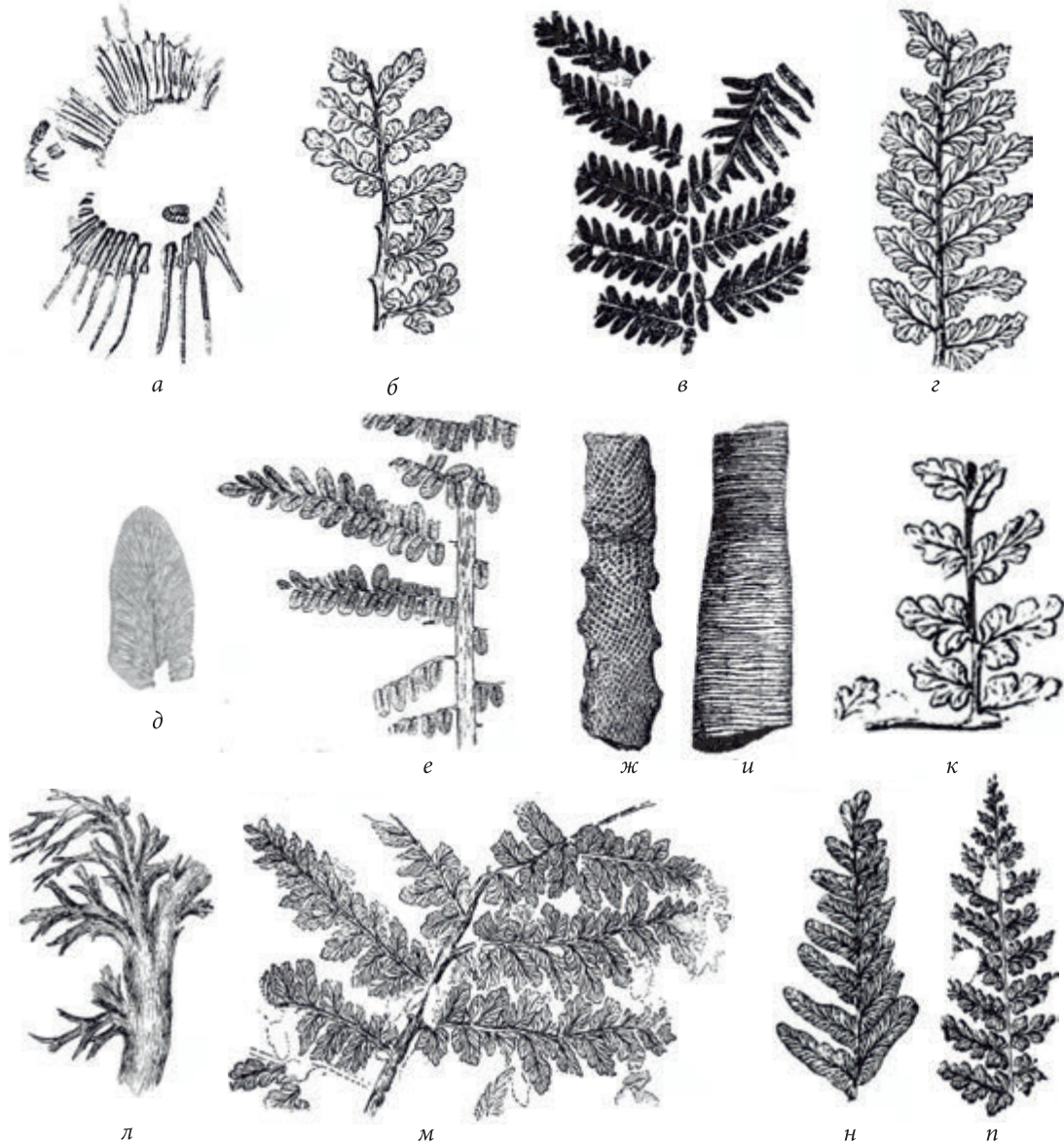
Рис. 3. Зображення деяких викопних рослин з білокалітвенської світи околиць м. Ровеньки в роботах М.Д. Залеського: а — Equisetum kidstoni Zalessky (Залесский, 1907а: табл. XIII, фіг. 6); б — Sphenopteris striata Gothan (Залесский, Чиркова, 1938: рис. 2); в — Alethopteris decurrens Artis (Залесский, Чиркова, 1938: рис. 53); г — Mariopteris nervosa Brongniart f. serrata Zalessky (Залесский, Чиркова, 1938: рис. 36); д — Neuropteris gigantea Sternberg (Залесский, Чиркова, 1938: рис. 70); е — N. heterophylla Brongniart (Залесский, Чиркова, 1938: рис. 71); ж — Halonia tortuosa Lindley et Hutton (Залесский, Чиркова, 1938: рис. 123); и — Artisia approximata (Brongniart) (Залесский, Чиркова, 1938: рис. 129); к — Mariopteris soubeirani Zeiller (Залесский, Чиркова, 1938: рис. 32); л — Aphlebia crispa (Gutbier) (Залесский, Чиркова, 1938: рис. 97); м — Mariopteris nervosa Brongniart f. serrata Zalessky (Залесский, Чиркова, 1938: рис. 37); н — Mixoneura obliqua (Brongniart) (Залесский, Чиркова, 1938: рис. 85); п — Mariopteris dernoicourti Zeiller (Залесский, Чиркова, 1938: рис. 34)

Fig. 3. Pictures of some fossil plants from the Belaya Kalitva Fm. near the Roven'ky Town in the works of Mikhail Zalessky: а — Equisetum kidstoni Zalessky (Zalessky, 1907а: pl. XIII, Fig. 6); б — Sphenopteris striata Gothan (Zalessky, Chirkova, 1938: Fig. 2); в — Alethopteris decurrens Artis (Zalessky, Chirkova, 1938: Fig. 53); г — Mariopteris nervosa Brongniart f. serrata Zalessky (Zalessky, Chirkova, 1938: Fig. 36); д — Neuropteris gigantea Sternberg (Zalessky, Chirkova, 1938: Fig. 70); е — N. heterophylla Brongniart (Zalessky, Chirkova, 1938: fig. 71); ж — Halonia tortuosa Lindley et Hutton (Zalessky, Chirkova, 1938: fig. 123); и — Artisia approximata (Brongniart) (Zalessky, Chirkova, 1938: Fig. 129); к — Mariopteris soubeirani Zeiller (Zalessky, Chirkova, 1938: fig. 32); л — Aphlebia crispa (Gutbier) (Zalessky, Chirkova, 1938: fig. 97); м — Mariopteris nervosa Brongniart f. serrata Zalessky (Zalessky, Chirkova, 1938: fig. 37); н — Mixoneura obliqua (Brongniart) (Zalessky, Chirkova, 1938: Fig. 85); п — Mariopteris dernoicourti Zeiller (Zalessky, Chirkova, 1938: Fig. 34)