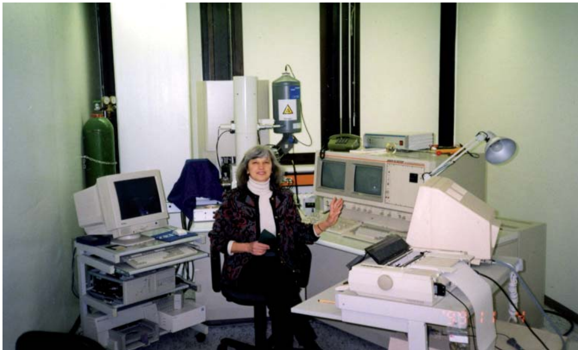
Рис. 5. Мікросондове дослідження метеоритів в Інституті планетології. Німеччина, Мюнстер, 2001 р.

Чи є у відділі проблеми? Звичайно є, причому хронічні. Перша з них — інструментальна база, друга — кадри, тобто відсутність істинного інтересу у молоді до наукової роботи. Матеріально-технічне забезпечення відділу явно не відповідає поставленим завданням дослідження. У період перебування в ІГНС НАН України відділ був ініціатором і промоутером в отриманні низьковакуумного електронного мікроскопа JSM-6490LV фірми JEOL (Японія) з енергодисперсним спектрометром OXFORD INCA Energy 350, використання якого впродовж 7 років сприяло проведенню тонких досліджень метеоритів. На цей час у відділі є лише оптичні мікроскопи і хімічна лабораторія, а мікросондові та електронномікроскопічні дослідження здійснюють на сучасній інструментальній