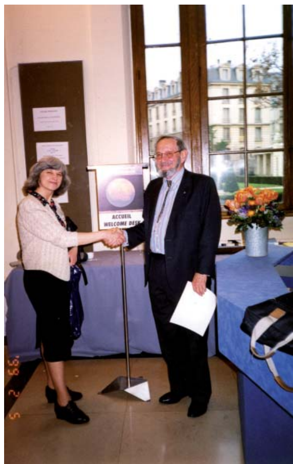
Рис. 4. Відомий космохімік професор Дж. Вассербург (США), який упродовж 1991—2002 рр. за власний кошт виписував і направляв на наш відділ коштовну щорічну підписку на журнал «Meteoritics and Planetary Sciences». Міжнародний симпозіум з вивчення Марса, Париж, 1999 р.

Слід зауважити, що особливе значення для розвитку космічної мінералогії в Україні мали наукова і фінансова підтримка відділу відомими закордонними дослідниками К. Пероном (Франція), Є. Ярошевичем, Г. МакФерсоном і Дж. Вассербургом (рис. 4) (США), А. Бішофом і Е. Єсбергером (Німеччина), С. Рассел (Велика Британія), а також спільні з ними дослідження рідкісного за своїми характеристиками українського метеорита Кримка в лабораторіях Франції, Німеччини (рис. 5) і США за такими науково-дослідними проектами: INTAS 93-2101(1.06.93—30.11.96) та INTAS 93-2101 Ext.