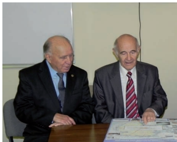
Фото. 3. С академиком Р.Г. Гарецким.

Изучение глубинного строения литосферы и тектонических процессов стало главным направлением лаборатории физики Земли Института геохимии и геофизики НАН Беларуси, возглавляемого академиком Р.Г. Гарецким. Руководить этой лабораторией в 1987 г. был приглашен профессор Г.И. Каратаев. Жизненные пути и научные интересы этих двух больших