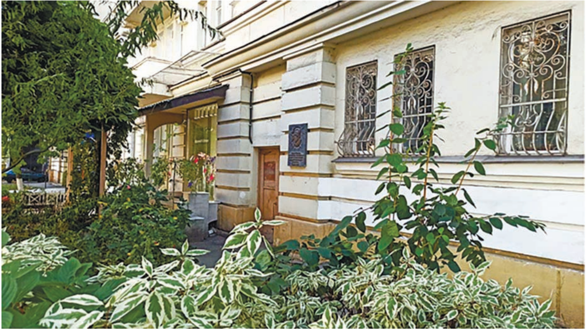
Фото 2. Під'їзд будинку № 15 по вулиці Гетьмана Павла Скоропадського, де встановлена меморіальна дошка пам'яті Анатолія Васильовича Чекунова.