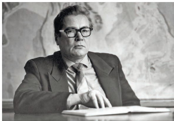
Фото 1. Чекунов Анатолій Васильович (1932—1996) — видатний український учений в галузі комплексного дослідження глибинної будови літосфери, доктор геолого-мінералогічних наук (1972), професор (1973), член-кореспондент (1973), академік АН УРСР (1979), лауреат Державної премії України в галузі науки і техніки (1984, 1995).

1 Тепер це вулиця Гетьмана Павла Скоропадського.