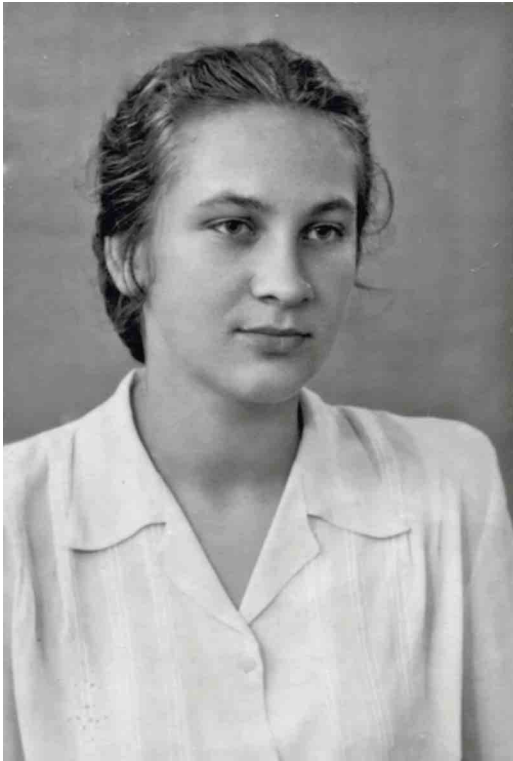
Фото 1. 15 червня 1952 р. Після закінчення десятиріччя.

Дивовижне Академмістечко! Скільки видатних вчених і просто чудових людей мешкало й досі мешкає в цих більш ніж скромних будинках! Скільки наприкінці 1960-х — на початку 1970-х років у нашій гостинці було написано дисертацій: хто де примудрявся це робити. Зрозуміло, що