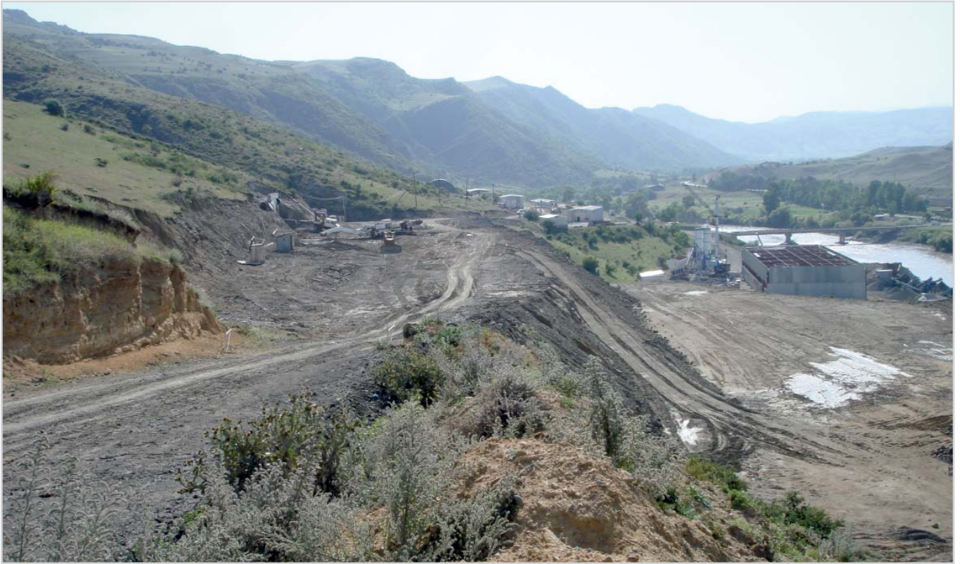
Строительная площадка МтквариГЭС

тери напора, что позволит увеличить установленную мощность ГЭС Мтквари и выработку электроэнергии.