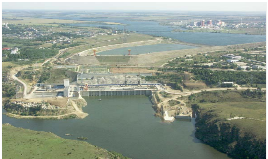
Панорама строительства Ташлыкской ГАЭС

Перспективные направления работы ПАО "Укргідропроєкт" в Украине связаны с дальнейшим развитием гидроэнергетического комплекса Украины, имеющего важнейшее значение для ра-