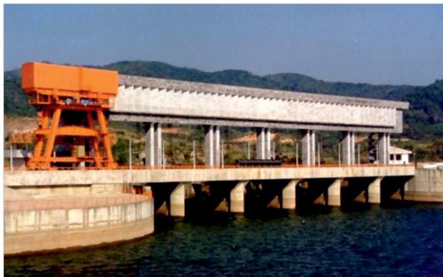
ГЭС Яли, Вьетнам

Ташлыкская ГАЭС вместе с Южно-Украинской АЭС мощностью 3 млн. кВт образует Южно-Украинский энергокомплекс, единственный в