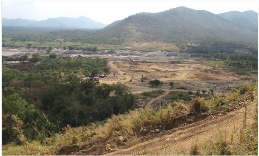
Строительство ГЭС "Великая плотина Эфиопского возрождения"

В Юго-Восточной Азии во Вьетнаме, где ПАО "Укрэнергопроект" участвовал в проектировании более десяти ГЭС, завершаются работы по строительству ГЭС Нам Чиен с арочной плотинной высотой 145 м и ГЭС мощностью 220 МВт, продолжают совместно с РЕСС1 проектные работы по ГЭС Луанг Прабанг на р. Меконг в Лаосе мощностью 1,3 млн. кВт, где ПАО "Укрэнергопроект" выполняет работы по судоходному шлюзу.