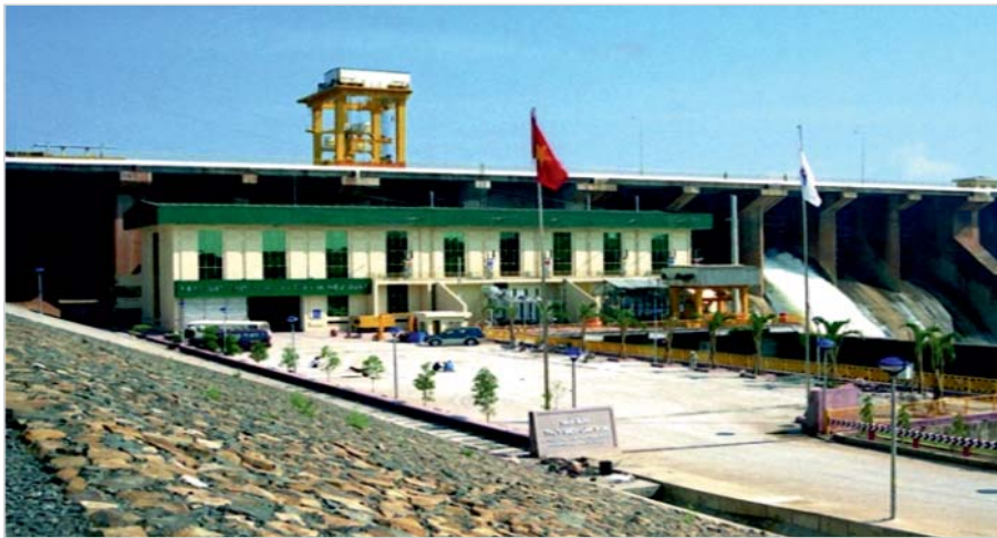
ГЭС Кан Дон, Вьетнам