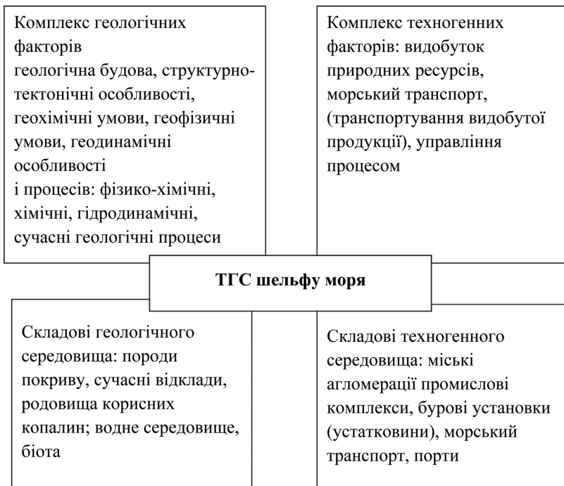
Рис. 1. Формування ТГС шельфу моря

Різноманіття геологічних особливостей, розглянутих при еколого-геологічних дослідженнях, дозволяє виділити серед них комплекс визначальних, що впливають в тій чи іншій мірі на формування геологічного середовища як еколого-геологічної системи. Цей комплекс включає в себе складові, які є факторами (компонентами) еколого-геологічних умов. Фактори формування еколого-геологічних умов – це ендегенно- і екзогеннообумовлені особливості розвитку певного геологічного об'єкту: 1) геологічна будова; 2) структурно-тектонічні особливості; 3) геохімічні умови; 4) геофізичні умови; 5) сучасні геологічні процеси (рис. 1). Новітнє розуміння екологічної геології обумовлює використання для оцінки геологічного середовища його вплив на умови існування біоти.