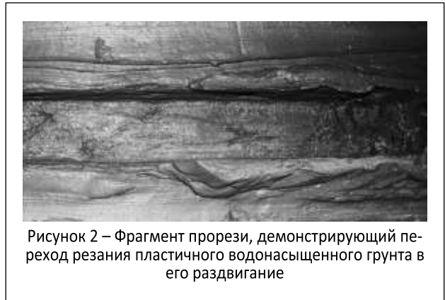
Рисунок 2 – Фрагмент прорези, демонстрирующий переход резания пластичного водонасыщенного грунта в его раздвигание

Согласно принятым обозначениям, заполнение ковша при копании осуществляется в промежутке времени 0 < t < t_{пр} ( t_{пр} – предельное время заполнения). При разработке пластичных водонасыщенных грунтов большая часть работы расходуется на преодоление сил межслоевого трения грунта вследствие контакта срезаемого пласта со стенками ковша, остальная часть – на разрушение структурных связей частиц грунта при его резании и деформировании. При t \geq t_{пр} изменение геометрических параметров грунтового кома и призмы волочения не происходит и вся работа затрачивается на перемещение призмы волочения и раздвигание грунта перед ковшом в стороны, образуя так называемые валики (рис. 2). В последнем случае усилие копания принимает максимальное значение.