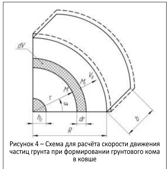
Рисунок 4 – Схема для расчёта скорости движения частиц грунта при формировании грунтового кома в ковше