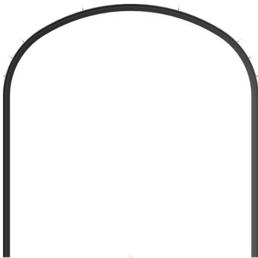
Рисунок 1 - Просторова модель рами аркового металевого кріплення з профілю СВІ-22