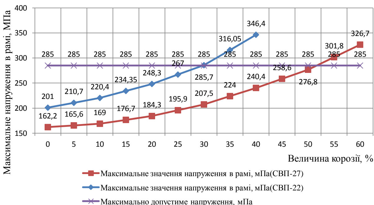
Рисунок 3 - Графік залежності росту напружень в рамі відносно ступеня корозії