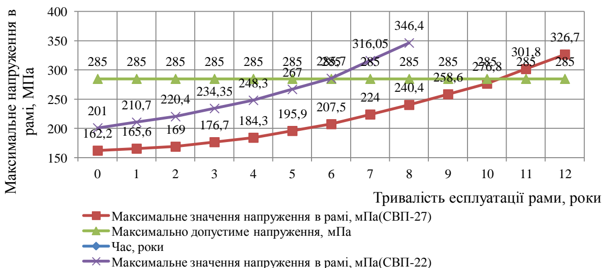
Рисунок 4 - Графік залежності росту напружень в рамі відносно терміну експлуатації