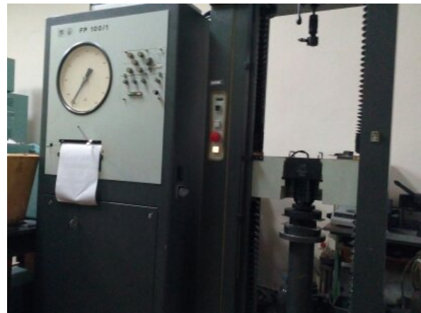
Рисунок 1 – Універсальний стенд FP100/1

Метою даних досліджень є випробування середньо наповненої гуми 2959 (на основі натурального каучуку з наповненням технічним вуглецем 45 мас. частин), модифікованої фулереновмісним технічним вуглецем (10 % фулерена C_{60} ,