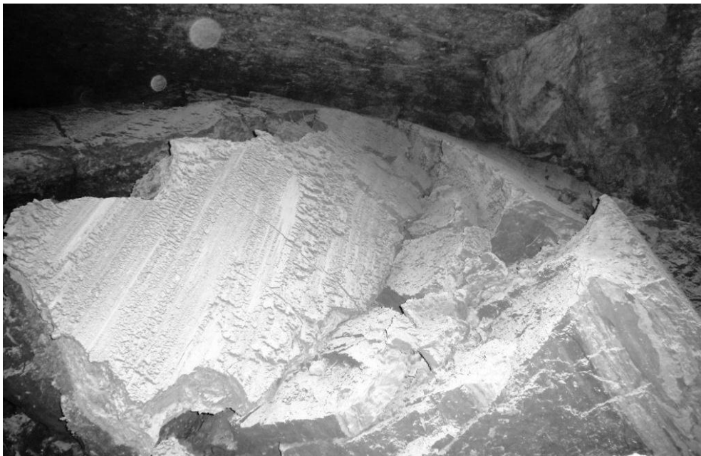
Рисунок 2 – Прорив пластичної геомаси в камеру при оголенні карсту в покрівлі виробки