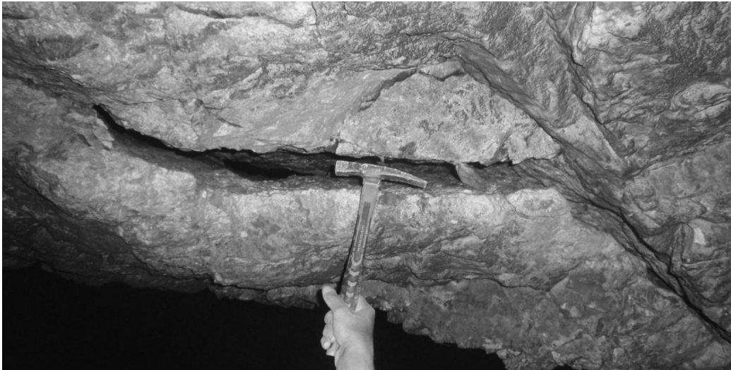
Рисунок 1 – Ризик обвалення породного блоку в покрівлі камери

розшарування покрівлі виробки, є варіація показників фізико-механічних властивостей породного масиву. В сукупності з технологічними параметрами, які входять в розрахункову схему і теж можуть змінювати своє значення в певних межах, це призводить до ризику в проектному рішенні. При виборі усереднених значень існує, можливо невеликий, але реальний ризик одночасного збігу відхилень розрахункових параметрів в бік зменшення запасу міцності елемента системи. В умовах гіпсової шахти це проявляється як обвалення покрівлі чи часткове руйнування цілика іноді через десятки років після початку експлуатації виробки.