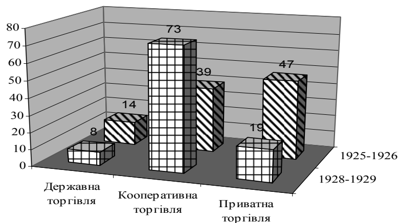
Рис. 1. Структура товарообігу в роздрібній торгівлі України в 1925–1929 рр., %

членам, відроджували експорт, проте вони залишались під особливим контролем та опікою держави.