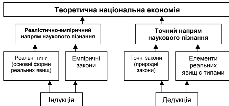
Рис. 2. Напрямки теоретичного пізнання за К. Менгером

К. Менгер, аналізуючи значення реалістично-емпіричного напрямку в економічних дослідженнях, зазначає: «Якщо розглядати світ явищ строго через реалістичний напрям, то закони їх є лише констатованими шляхом спостереження фактичними правильностями (закономірностями) у послідовності і співіснуванні реальних явищ, що належать до відомих форм явищ» [3, с. 320]. Якби існував лише цей напрям теоретичного дослідження, то не існувало б можливості та фундаментальності будь-якого дослідження, що могло розглядатися для розроблення точної теорії. Саме тому реалістично-емпіричний напрям теоретичного дослідження є одностороннім.