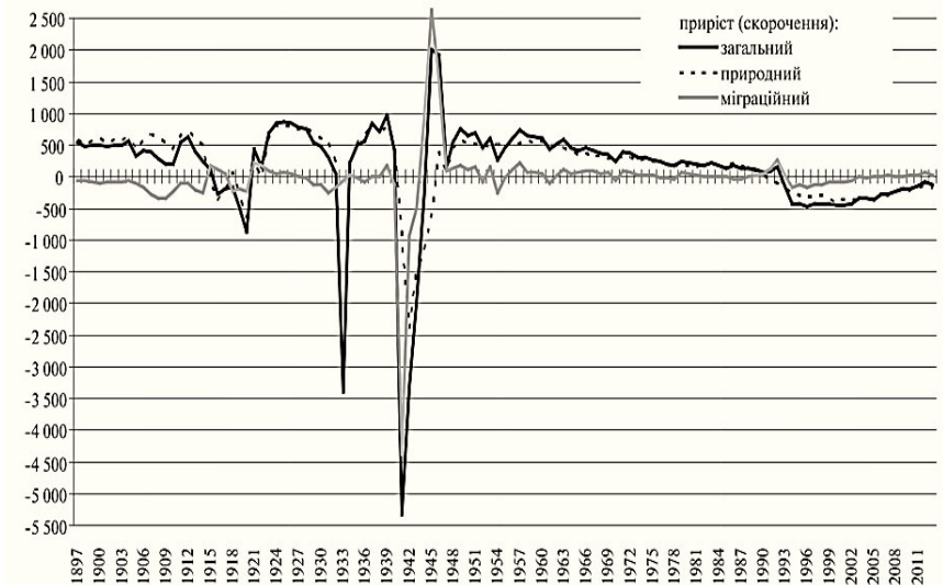
Рис 1. Загальний, природний та міграційний приріст (скорочення) населення України.

Розглядаючи графіки (Рис. 1 та Рис. 2), в яких наведено загальний, природний та міграційний приріст (скорочення) населення в Україні у 1897–2013-х роках, тис. осіб, та кількість померлих за статтю, бачимо різке, але однакове скорочення жіночого та чоловічого населення України у 1932–1933 рр., але в 1939–1945 рр. бачимо різке скорочення чоловічого населення, але менш різке скорочення жіночого населення.