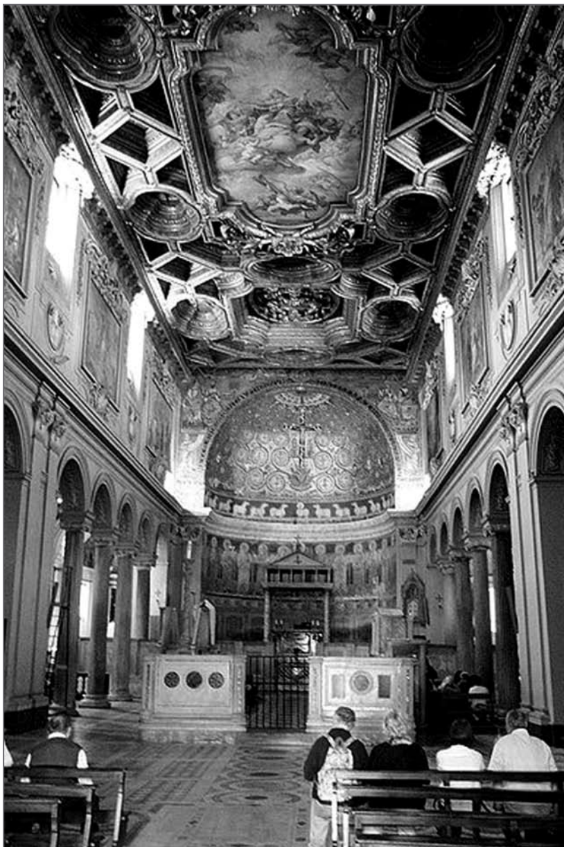
Лл. 3. Головний вівтар і хори Базиліки Святого Климента у Римі