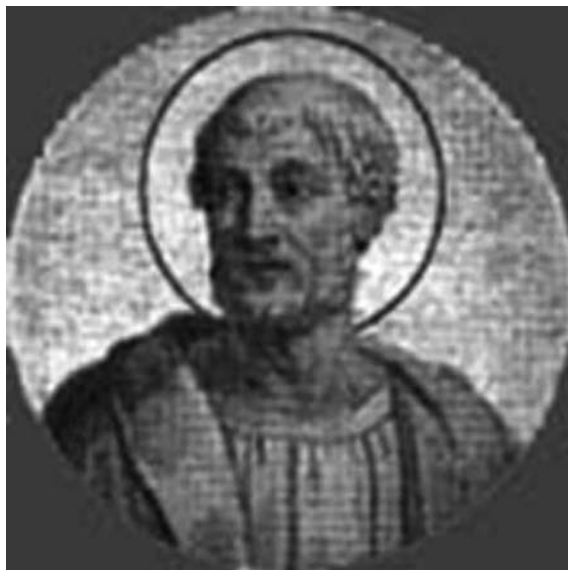
Іл. 1. Святий великомученик папа Климент

За іншими даними Климент народився у 30 р. і помер мученицькою смертю у 92 р. Деякі дослідники заперечують