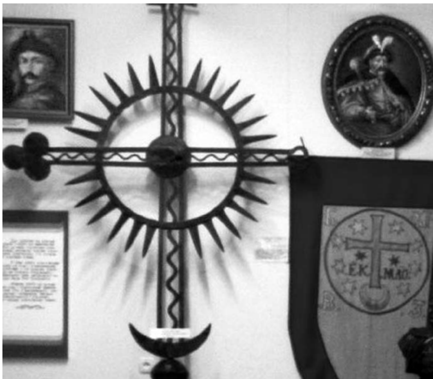
Іл. 4. Запорізький хрест-якір і прапор війська Богдана Хмельницького в експозиції Нікопільського краєзнавчого музею

цього викутого із заліза хреста завершують трилисники, а в центрі його розташоване сонце. Поруч з хрестом в експозиції знаходиться автентична копія прапора війська Богдана Хмельницького (оригінал в королівському військовому музеї м. Стокгольма), на якому теж центральною фігурою виступає хрест якірного типу (іл. 4).