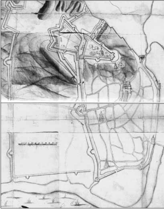
Гл. 1. План Чигирин 1678 року, що входить до щоденника Патріка Гордона, рукопис якого є в Російському державному військово-історичному архіві у Москві

го знаходяться у заповітах Тишка Волевача – «Пречиська» церква 17 та Івана Волевача 18 .