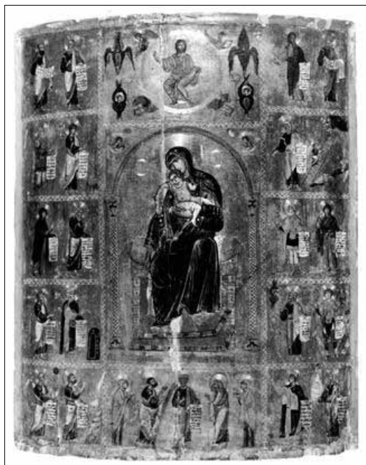
Іл. 6. Кікська Богородиця з вибраними святими на полях (ікона з монастиря св. Катерини на Сінаї, поч. XII ст.)