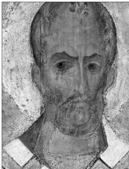
Іл. 5. Фрагмент ікони Св. Миколай «Новодівичий». Сер. XII ст.

Форма голів Марії та Емануїла доволі видовжена, що нетипово для такого типу зображень. Єдиний відомий їй аналог бачимо на аналізованому образі Св. Миколая (іл. 4 і 5). На наш погляд, це одна з найсуттєвіших рис, яка доводить спорідненість цих творів, – навіть попри те, що лики святих осіб на білозерській іконі написані на значно щільнішому підкладі. Наголосимо також, що за психологічними характеристиками лики Білозерської Богоматері та Св. Миколая – найдраматичніші в усій сакральній традиції Русі-України (іл. 4 і 5). Про це свідчить і максимальна повнота виразу трагічних почуттів: перебільшено-експресивні риси ликів, аж до цілковитої трансформації їхніх рис, на рівні поглибленої спірітуалізації не мають аналогій у східнохристиянському мистецтві. Це вже цілком інший етап у його розвитку, на що вказує порівняння зі зразками піднесено-величавих образів Богородиці київської школи попереднього століття (Велика Панагія, Печерська, Корсунське Благовіщення, Св. Юрій-воїн і низка ікон Золотоволосого Спасу й Архангелів) 11 .