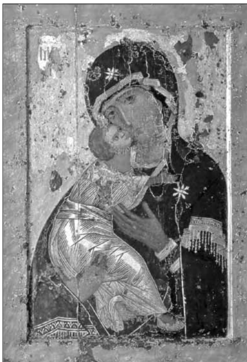
Іл. 3. Ікона Вишгородської Богоматері, Константинополь (ДТГ, Москва, поч. XII ст.)

Зміни в образі людини через розкриття її внутрішнього стану найперше торкнулися монументального мистецтва, котре було важливим джерелом новацій в іконописі та мініатюрі. Мовиться про Михайлівські мозаїки (1108 р.), що стали останнім мозаїчним комплексом у Києві (з того часу в храмах княжої Русі використовуватиметься лише фреска). Такі невід'ємні властивості фрески, як багатоколірність і динамізм письма, неодмінно вплинуть на іконописну традицію. Суттєвому оновленню іконописної стилістики з XII ст. також сприяло вже згадане звернення до внутрішнього світу людини, яке в мистецтві йшло в парі з поширенням оплічних і крупноголових зображень. У часі це збіглося з появою в 1125 р. візантійських ікон Богоматері Пирогощої та Вишгородської (іл. 3).