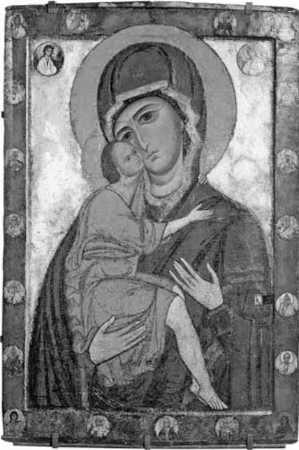
Іл. 1. Ікона Білозерської Богоматері київської школи (Державна Третьяковська галерея, Москва, сер. XII ст.)

Літописи зберегли цінну інформацію про масові вивезення мистецьких раритетів на північ Русі через системні пограбування Києва, починаючи з другої половини XII ст. У цьому контексті цікавою є історія двох знакових творів, походження яких безпосередньо пов'язане з київськими художніми традиціями: Білозерська Богоматір (іл. 1) та Св. Миколай «Новодівичий» (іл. 2). Їхнє створення науковці датують серединою XII – початком XIII ст. Десь у XIII ст. ікона Богородиці потрапила до міста Білозерськ, що було тоді на території Ростовського князівства. Її первісний вигляд практич-