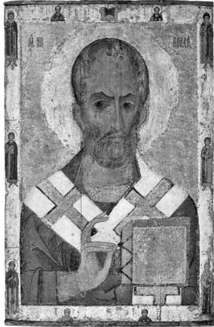
Іл. 2. Ікона Св. Миколая Новодівичо- го київської школи (Державна Третьяковська галерея, Москва, сер. XII ст.)