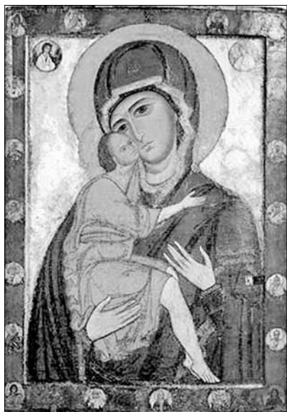
Іл. 7. Білозерська Богоматір. Ікона київської школи (Державна Третьяковська галерея, Москва, сер. XII ст.)