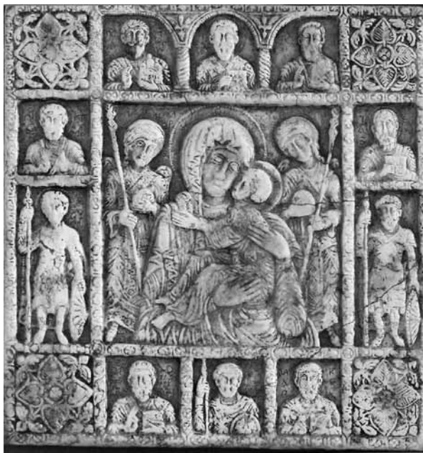
Іл. 8. Богородиця зі свя- тими, рельєф (м. Ро- день, приватна збірка, сер. XII ст.)

У Київській Русі не було прецеденту Богородиці з Похвалою та Миколая зі святими. Аналогія до Похвали – Кікська, проте там Звеселення (іл. 6), а в Білозерській – Єлеуса (іл. 7). Тільки рельєф Богоматері-Єлеуси (Мономаховий) 12 (сер. XII ст.) найближчий до Білозерської (іл. 8).