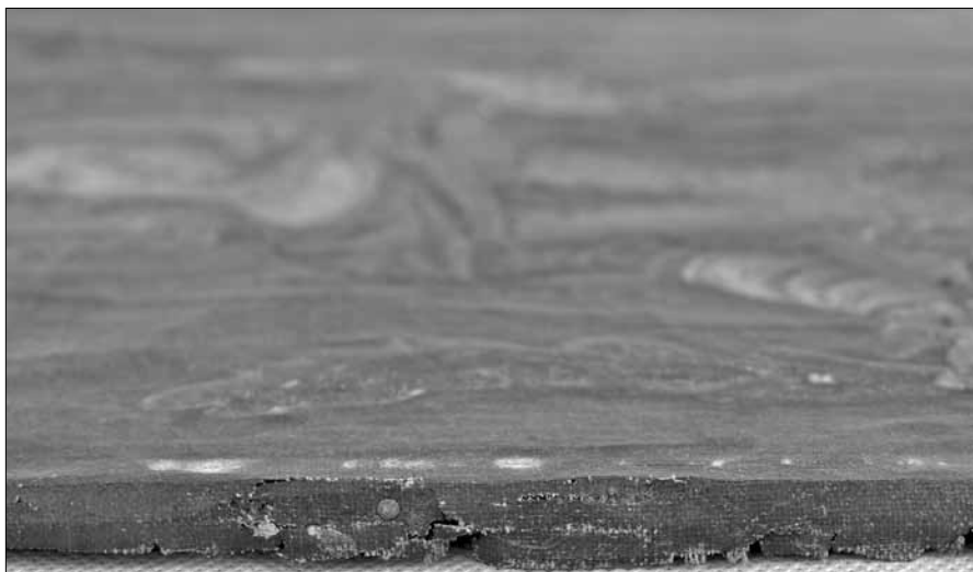
Іл. 3. Торець ікони «Свята Текля» до реставрації

Захисний шар – тонка тьмяна пожовтіла лакова плівка, яка відсутня під металевими частинами окладу, нанесена, ймовірно, під час попередньої реставрації. Трапляється місцеве затікання лаку під накладний німб.