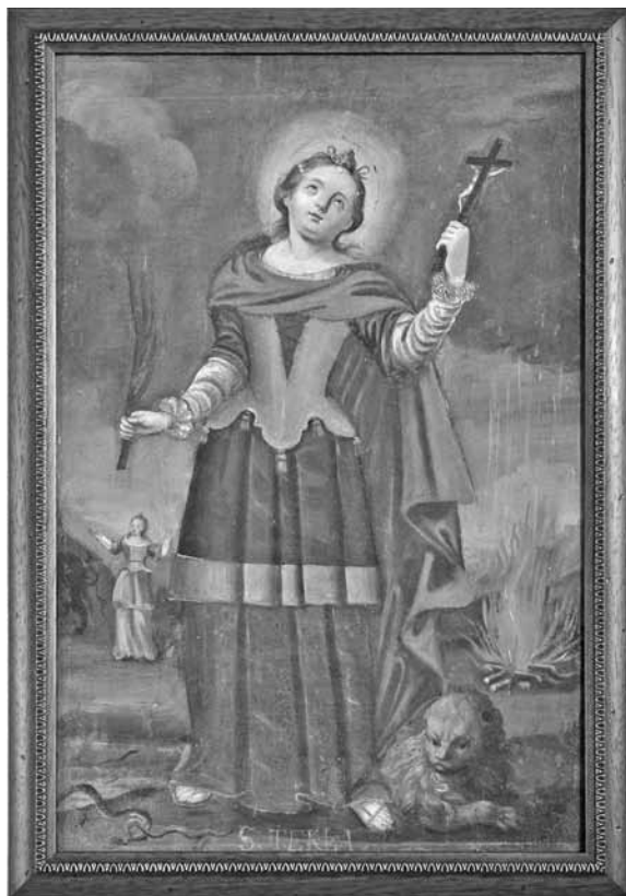
Іл. 4. Ікона «Свята Текля» після реставрації, полотно, олія; оклад: мідь, скло, позолочення, посріблення, жакардова тканина

нув святу. Але Той, що замкнув уста левам, Той і зміям притупив жала. І вийшла свята звідтіля неушкоджена» 5 .