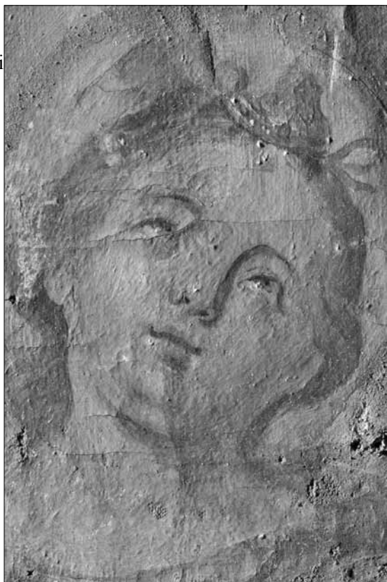
Іл. 4. Фрагмент зображення лику святої Теклі до реставрації

тами. Поверх червоного підкладу тонко прописано синьою фарбою складки плаття, прикрашеного золотим окантуванням (шиттям). Поверх плаття – коротка туніка синього кольору, оздоблена жовто-вохристою широкою смугою на облямівці та золотистим корсетом з кутасиками й шнурівкою спереду. На плечі святої накинуто плащ червоного кольору, який ззаду та справа опускається до самого подолу. На ногах у святої сандалі, що кріпляться до ноги ремінцями. Пейзаж в оливково-коричневих тонах ніжно поєднується з блакитною даллю неба, створюючи делікатний фон, що акцентує всю увагу на постаті святої.