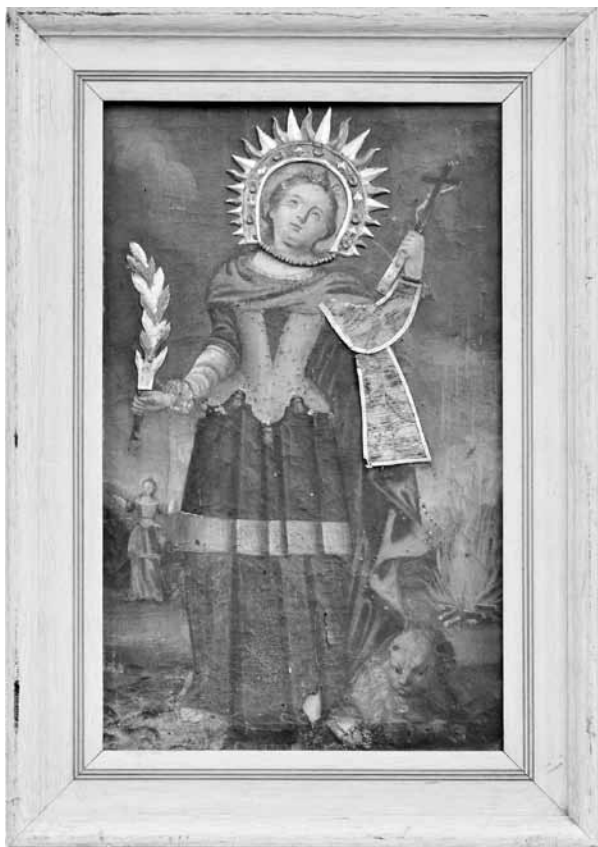
Іл. 2. Ікона «Свята Те- кля» до реставрації, полотно, олія, іконний оклад

Після зняття полотна з фанери виявлено, що нижній правий кут є вставкою, приклеєною «устик». Нитка основи вставки проходить діагонально до нитки основи полотна (основного). Вставка прогрунтована та має фарбовий шар, лакову плівку. Вставка ніби вирізана з живописного полотна, має тональну градацію від світлішого до темнішого і є дещо світлішою від живопису, що її оточує. Це свідчить про попередню реставрацію твору.