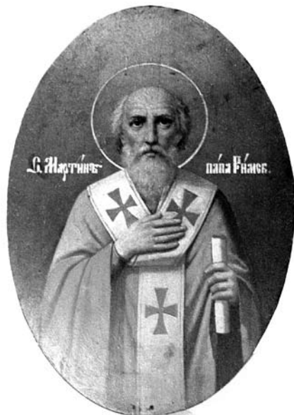
Іл. 5. Свяціцель Марцін Іспаведнік, папа Рымскі.

На абразе авальнай формы прадстаўлена паясная выява свяціцеля Марціна з сівымі барадой і вусамі і непакрытай галавой. У левай руцэ ён трымае скрутак, а правую прыціскае да грудзей. З абодвух бакоў выявы змешчаны надпісы: «С. Мартинъ папа Римск.».