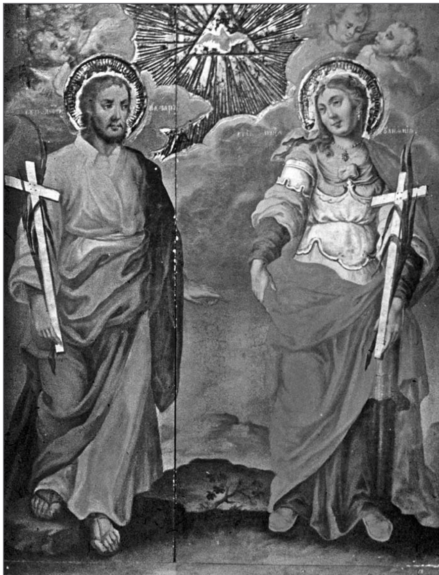
Лл. 7. Св. пакутнікі Назарый і Іуліанія Нікамідзійская. Магілёў. 1823 г. Дошка, тэмпера, 95×75