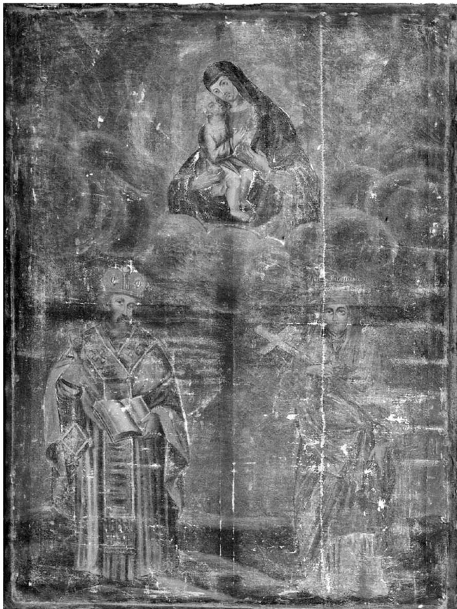
Іл. 6. Св. Макрына і свяціцель Васіль Вялікі. Камянецкі раён Брэсцкай вобл. VIII ст. Палатно, алей, 146×100