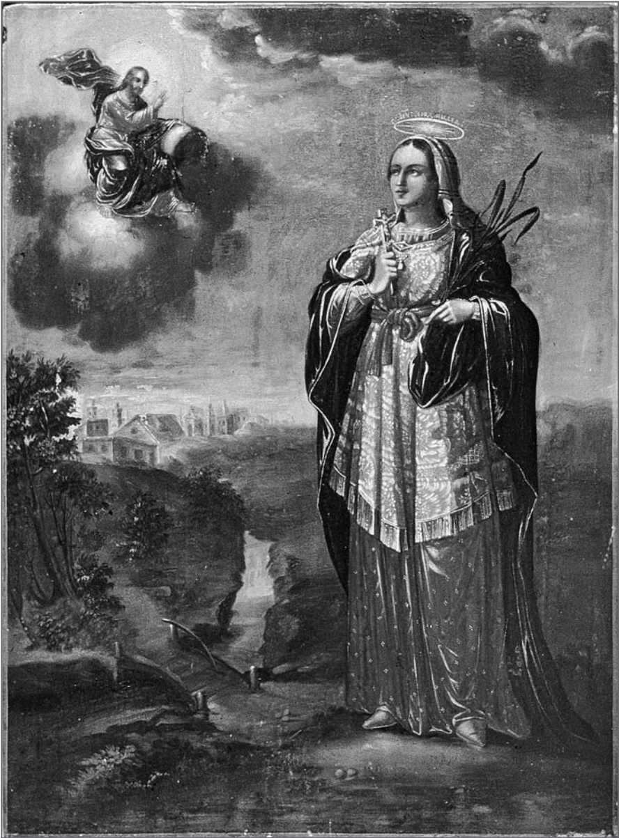
Іл. 3. Св. пакутніца Людміла. Брэст. XIX ст. Дошка, алей, 71×53