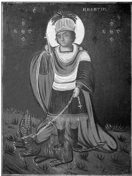
Іл. 8. Св. пакутнік Нікіта Бесагон. Глыбоцкі раён Віцебскай вобл. Пач. XIX ст. Дошка, алей, 40×29

На двух абразках, выкананых ў інсітным стылі, што зафіксаваны ва ўсходніх рэгіёнах Беларусі, замест сцэны пабівання прадстаўлена даволі статычная кампазіцыя, дзе св. Нікіта ў воінскіх даспехах і доўгім чырвоным плашчы трымае павержанага д'ябла на ланцугу. На абразе з Віцебскай вобл. (іл. 8) ён левай нагой прыціскае д'ябла да зямлі, а