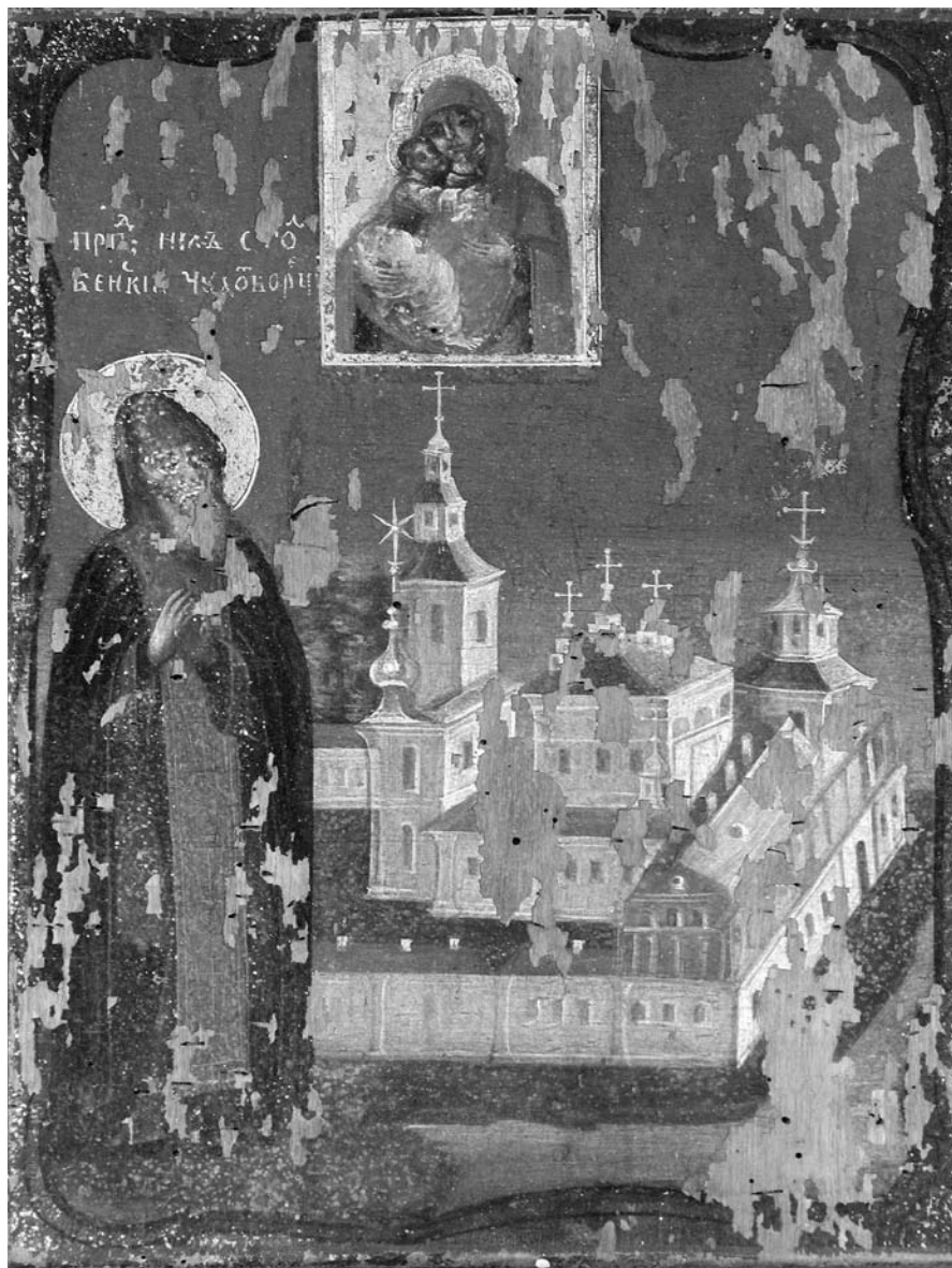
Іл. 9. Прѣподобны Нїл Сталобенскї. Івацѣвцїкї раѣн Брѣсцкай вобл. ХІХ ст. Дошка, алеї, 31×24