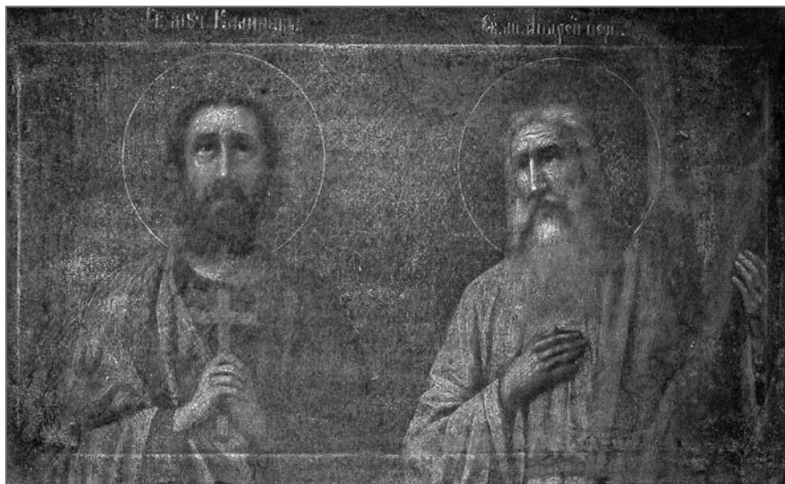
Іл. 2. Св. пакутнік Каллінік. Бярозаўскі раён Брэсцкай вобл. Другая палова XIX ст. Палатно, алей, 36×60

На адзіным абразе з Брэсцкай вобл. св. Каллінік прадстаўлены ў паясной выяве разам з апосталам Андрэем Першаазваным ( іл. 2 ). Святы пакутнік абодвума рукамі прыціскае да грудзей крыж, яго позірк скіраваны ўверх.