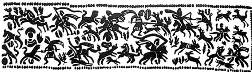
Il. 2. Forma powtarzającego się wzoru, wybijanego na dolnej taśmie hełmu z Chalon-sur-Saône we Francji. W 1002. Rysunek autora, na podstawie: Vogt M. Spangenhelme. Bandenheim und verwandte typen – Mainz, 2006 – beilage 3

Hełm z Chalon-sur-Saône we Francji obecnie znajduje się w Deutsches Historisches Museum w Berlinie, inw. nr. W 1002. Na szczególną uwagę zasługuje najlepiej zachowana dolna taśma dekoracyjna. Ozdobiona została powtarzającym się pięciokrotnie motywem ( il. 2 ). Przy czym sam motyw dekoracyjny nie został dopasowany bezpośrednio do wielkości hełmu. Na tylnym łączeniu dwa fragmenty nachodzą na siebie i sama dekoracja została skrócona. Ukazuje ona po pięć polowań, rozłożonych w dwóch rzędach – górnym i dolnym. Polowania zarówno konne, jak i piesze. Nie można zauważyć żadnego logicznego kierunku czytania przedstawień. Każde z polowań można czytać jako osobną scenę przemocy, w której następuje konfrontacja z bestią.