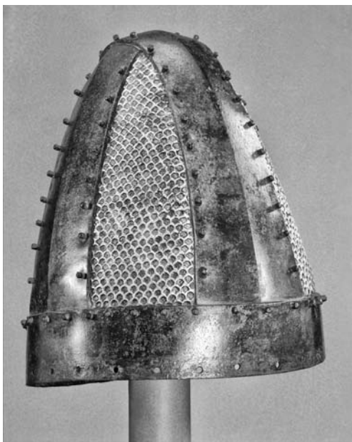
Il. 1. Hełm późnosasanidzki typu crossbandhelme o prostych żebrach (The Metropolitan Museum of Art, Nowy Jork, Access Nr. 62.82)

puszczać, że hełmy typu cross-bandhelme reprezentowane chociażby przez hełmy z Musées Royaux d'Art et d'Histoire w Brukseli (inv. Nr. Ir.13.15) czy hełm z The Metropolitan Museum of Art w Nowym Yorku (Inv. Nr. 62.82) ( il. 1 ), o prostych końcach żeber reprezentują, podobnie jak ma to miejsce z europejskimi hełmami typu spangenhelme, późniejszą ewolucję w obrębie jednego typu. Skutkowałoby to uznaniem typu Amlash jako wersji pierwotnej wśród irańskich konstrukcji. Teza ta nie pozwala jednak na chronologizację samych zabytków, ponieważ nie sposób wykluczyć, że hełmy o łukowatych podstawach żeber, jako odrębna forma wewnątrz jednej grupy, używane były równolegle do nowo powstających ewolucji.