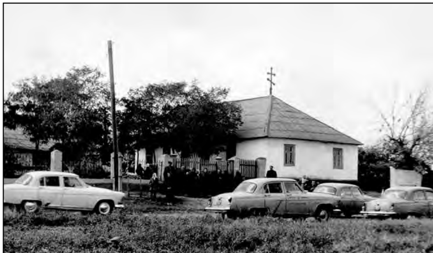
Іл. 2. Святомиколаївська церква села Покровське