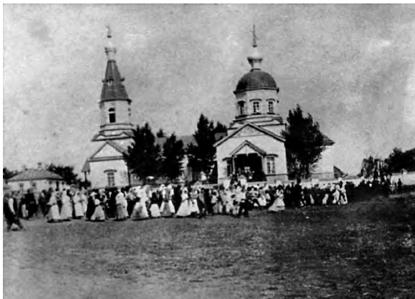
Іл. 1. Покровська церква села Карлівка-І (с. Кліщіївка)

Розглянемо в цьому контексті історію Кліщіївської та Покровської церков Бахмутського (до 2015 р. – Артемівського) району Донецької області. Вона пов'язана із життям сповідника віри ігумена Йоана (Тихона Яковича Стрельцова, 1885–1970) – останнього ігумена Святогірського монастиря в 1926 р. ( іл. 1 ).