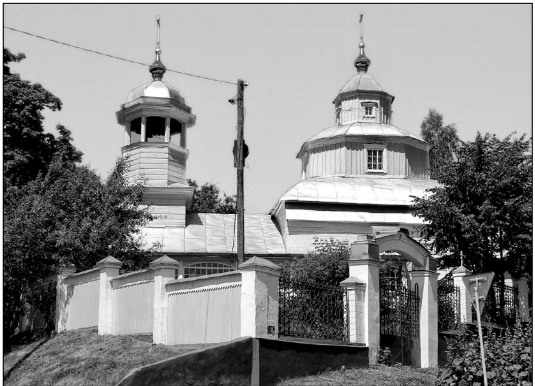
Іл. 5. Ільінская царква. Гомель. 1794

Ільінская царква ў Гомелі пабудавана ў 1793–1794 гг. як стараабрадніцкая (іл. 5). У трохзрубавай кампазіцыі храма выразна дамінуе кубападобны кафалікон, увенчаны двума ярусамі светлавых васьмерыкоў, падзеленых шырокімі прычолкамі. Пяцігранны алтарны зруб і вялікі бабінец значна больш нізкія за асноўны зруб. Над бабінцам надбудавана двух’ярусная вежа-званіца (васьмерык на чацверыку). Верхнія васьмерыкі кафалікона і званіцы