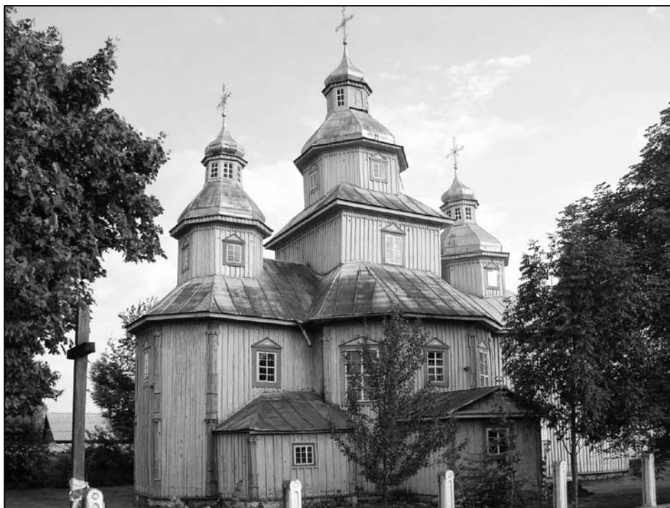
Іл. 1. Міхайлаўская царква. Рубель. Столінскі р-н. 1796 г.