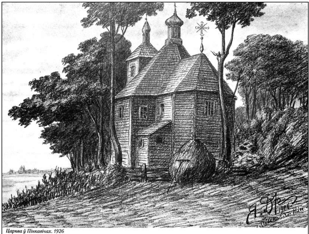
Царква ў Пінкавічах. 1926