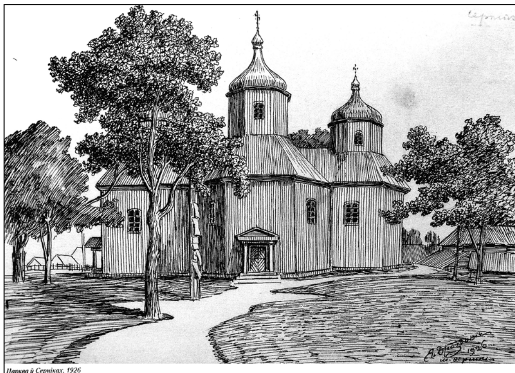
Іл. 6. Царква в. Сернікі пад Пінскам. Малюнак Я. Драздовіча 1926 г.

Трохзрубавую кампазіцыю з васьмігранным асноўным і пяцігранным алтарным зрубамі і квадратным бабінцам пад агульным дахам мела царква ў Серніках (іл. 6), замалёваная Я. Драздовічам “на Піншчыне” ў 1926 г. [10, с. 65]. Кожны