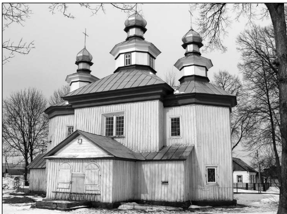
Іл. 2. Мікалаеўская царква. Старая Беліца. Гомельскі р-н. 1770-я гг.