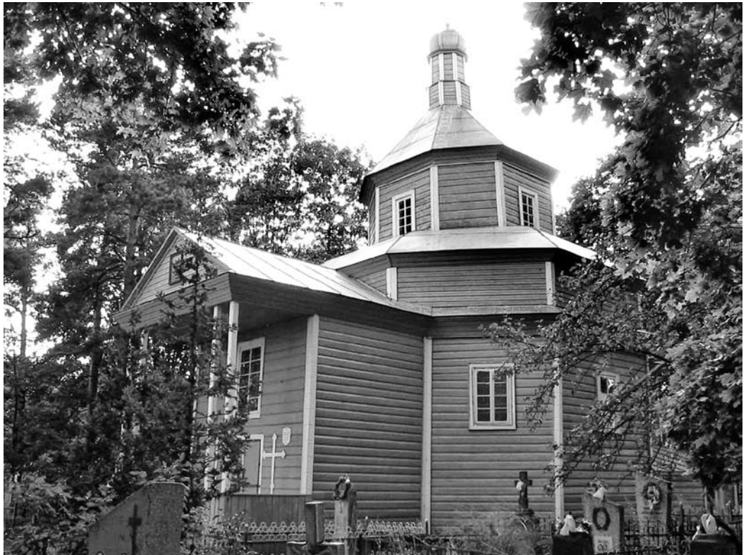
Іл. 7. Петрапаўлаўская царква. Галынка. Клецкі р-н. 1789 г.

зруб завяршаў светлавы верх у выглядзе магутнага васьміграннага барабана з грушападобным купалам. Цяпер гэтая вёска знаходзіцца ў Ровенскай вобласці Ўкраіны, недалёка ад беларускага горада Столін. Да таго ж тыпу адносіцца Петрапаўлаўская царква ў в. Галынка (б. Слуцкі павет, цяпер Клецкі р-н), пабудаваная як уніяцкая ў 1788–1789 гг. па фундацыі зямляніна Чыжа (іл. 7). Помнік спалучае рысы барока і класіцызму: фігурны гранёны купал, вертыкальная шалёўка з нашчылнікамі, развітыя прафіляваныя карнізы, паўцыркульнае акно на галоўным фасадзе. Трохзрубавы храм з васьмігранным двухсветлавым асноўным зрубам, выцягнутым ў папярочным напрамку, і квадратнымі бабінцам і алтарным зрубам, якія накрытыя двухсхільнымі дахамі з трохвугольнымі франтонамі на тарцах. Інтэр’ер кафалікона перакрыты самкнутым скляпеннем. Царква перабудоўвалася ў 1863 і 1990-я гг.: прыбудаваны чатырохкалонны порцік, купал заменены шатром з вежачкай.