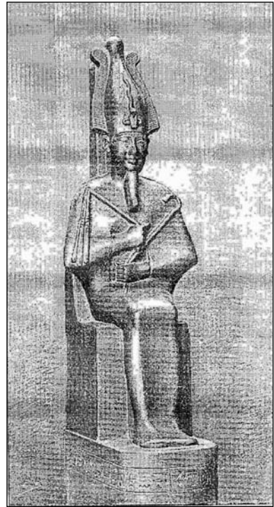
Іл. 4. Зображення скульптури Осіріса з книги Г. Масперо (1895)

Отже, на сьогодні на території України відомо дев’ять знахідок предметів східного культу. До них можна додати ще принаймні дві статуєтки виявлені “чорними копачами” і відомі з інтернет-аукціонів. Гадаємо, не буде зайвим черговий раз наголосити, якої катастрофічної шкоди завдають ці “любители детекторного пошуку” історичній науці, вибираючи цікаві для них предмети з археологічних пам’яток. У нашому випадку місця знаходження цих двох статуєток не відомі, але позитивним у цій ситуації є те, що на відміну від вищеперерахованих дев’ятьох знахідок, ми можемо бачити їхні зображення завдяки публікації в мережі інтернет. Наприклад, у 2015–2016 рр. на інтернет-аукціоні Violity було відстежено появу бронзового погруддя бога Серапіса (вис. 4,5 см) з Волині та його бронзової голови (вис. 7 см) з Київщини [17; 18].