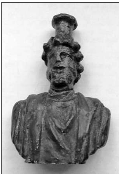
Іл. 3. Фрагмент бронзової статуетки Серапіса з с. Хрінники

напівземлянці-святилищі № 90, разом з матеріалом першої половини III ст. [11, с. 60–65]. Про знахідку згадує також Б. Магомедов [20, с. 180, № 39]. На даний момент фігурка зберігається у фондах Рівненського обласного краєзнавчого музею, інв. № РОКМ КН23518 ПАК 3935 (іл. 3).