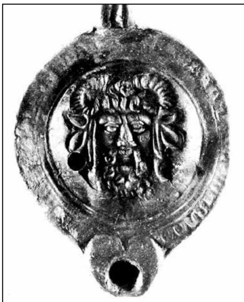
Ил. 5. Глиняний світильник із зображенням Зевса-Амона в клеймі з Херсонеса з монографії М. Кобиліної (1978) (№ 21)