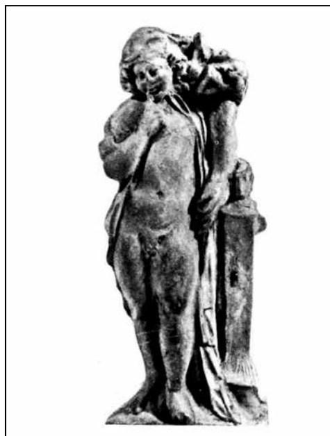
Іл. 2. Теракотова статуетка Гарпократів із рогом достатку з Пантікапея з монографії М. Кобиліної (1978) (№ 15)

лівій руці тримає великий ріг достатку. Вказівний палець його правої руки прикладений до вуст, на плечі накинутий плащ [25, с. 130, № 15] (іл. 2). Подібної форми є фрагмент статуетки Гарпократів (І ст. н. е.) місцевого виробництва, виявлений на території Кепів [25, с.130, № 16].