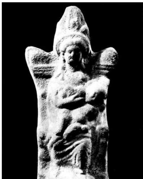
Іл. 1. Теракотова статуетка Ісіді із немовлям Гором з Пантікапея, з монографії М. Кобиліної (1978) (№ 10)