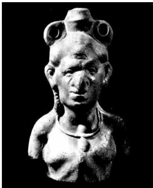
Ил. 4. Теракотова фігурна посудина у вигляді Патеки з Ольвії з монографії М. Кобиліної (1978) (№ 26)

Голова Зевса-Амона з баранячими рогами зображена на світильнику I ст. н. е. з Херсонеса [25, с. 132–3, № 21] (ил. 5).