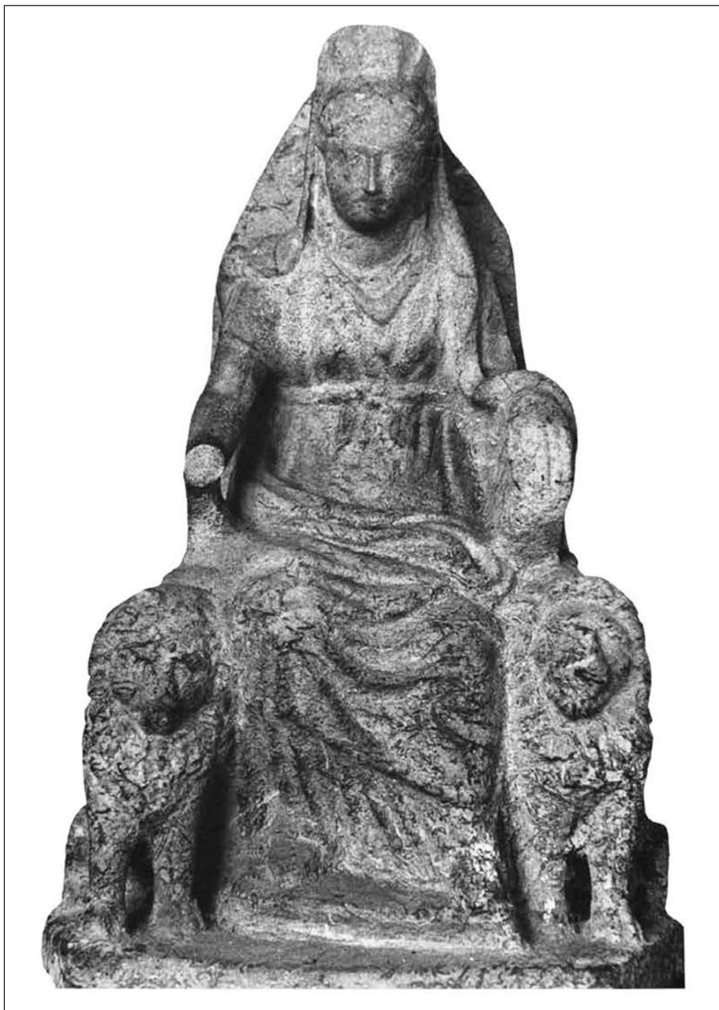
Іл. 3. Матір богів з двома левами, I–II ст. н. е., Херсонес (за СССА VI, 551)