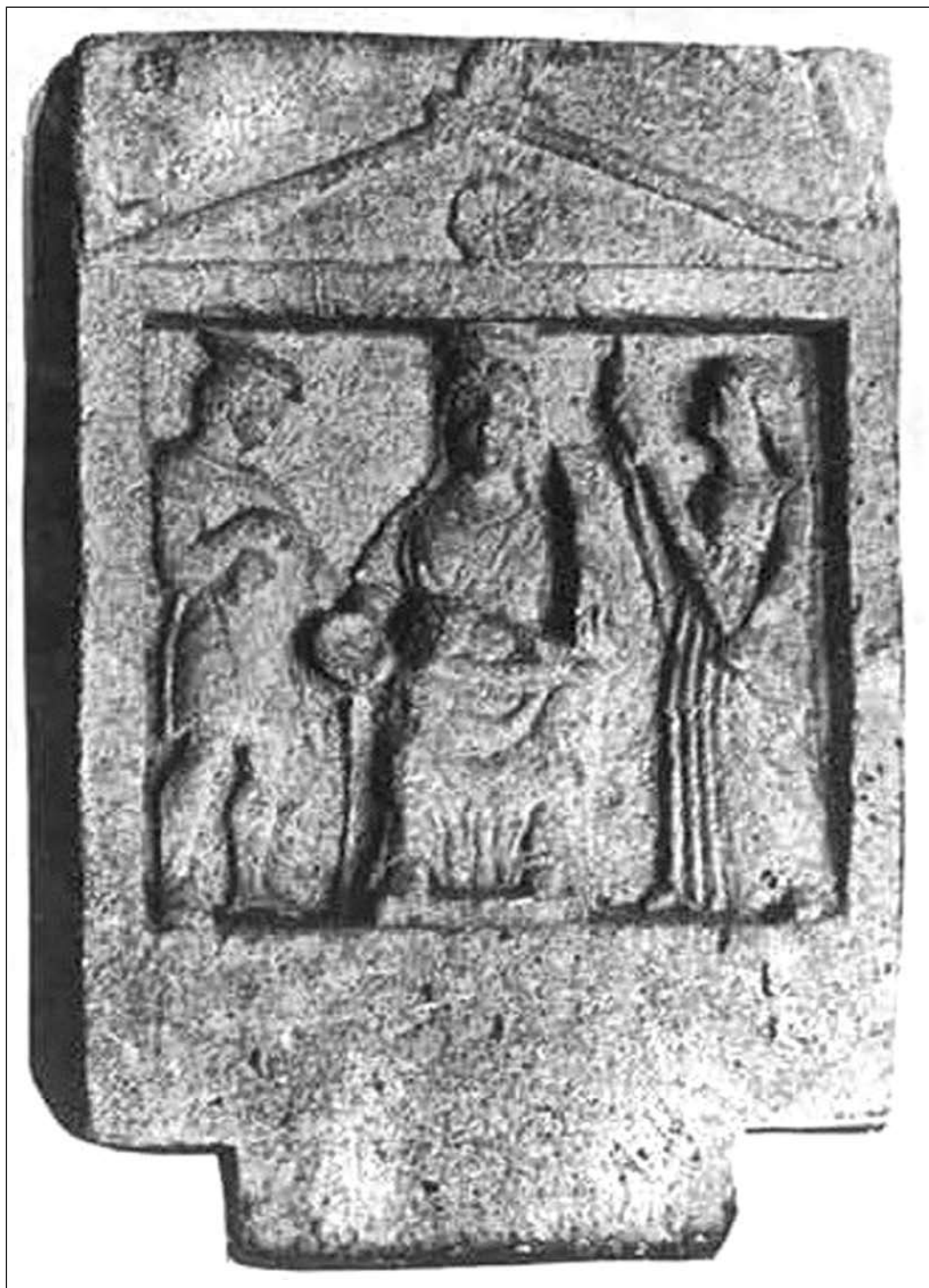
Іл. 6. Матір богів в компанії Гермеса та Кори або Гекати, I ст. н. е., Пантікапей (за CCCA, VI, 588)