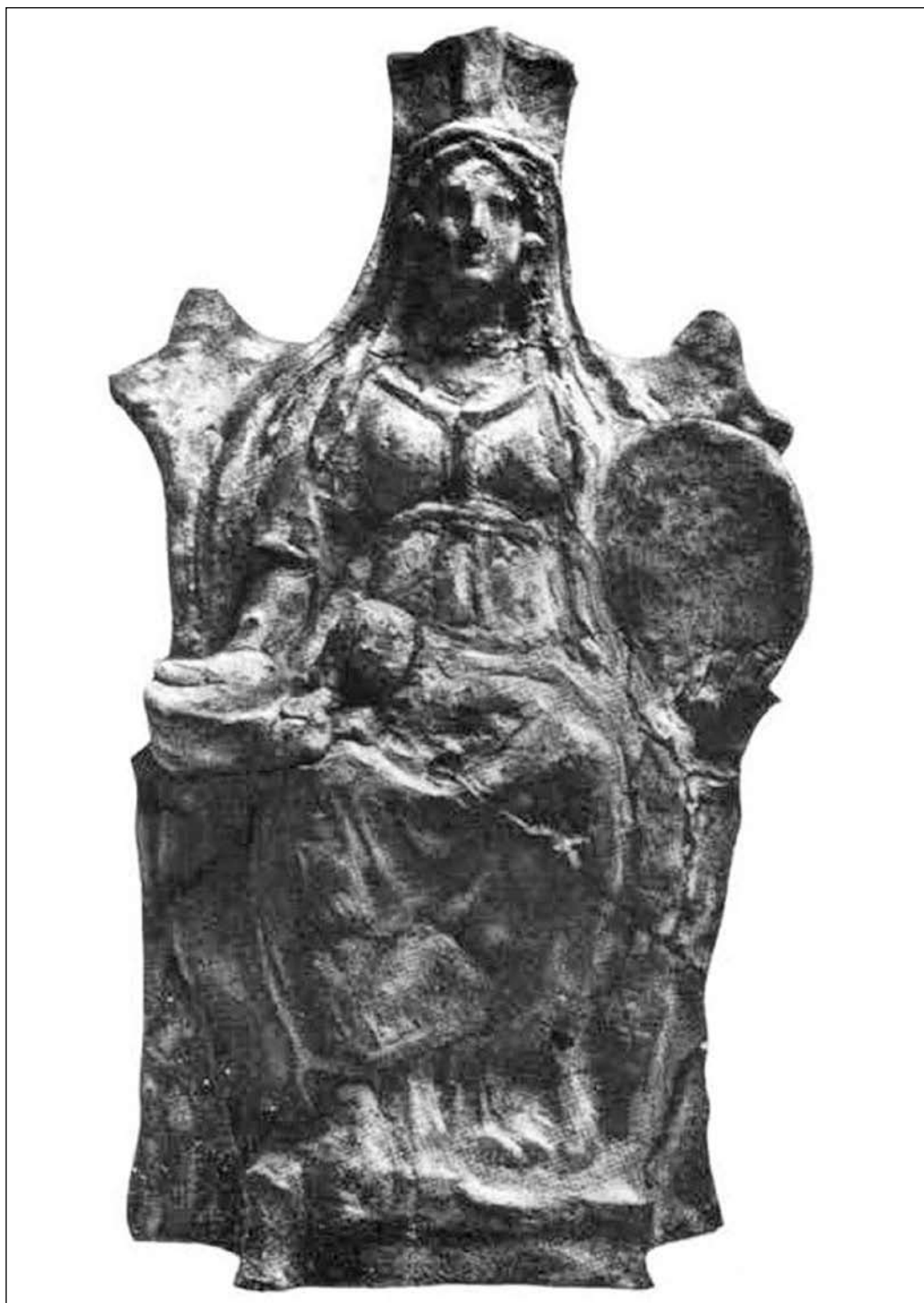
Гл. 1. Матір богів, III ст. до н. е., Ольвія (за СССА, VI, 513)