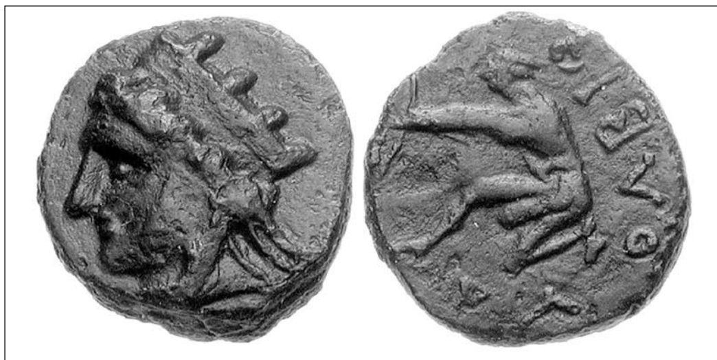
Лл. 8. Мідний халк із зображенням богині з баштовою короною на голові, 360–350 рр., Ольвія (за Каталог-архів “Монеты Тавриды: Херсонеса Таврического, Керкинитиды и городов Северо-Западного Причерноморья”, № 475–4751)

П. Бурачков бачив там Деметру (Бурачковъ, 1884, с. 68–69, № 191–200). У сучасних каталогах цю богиню одностайно трактують як Тіхе (Анохин, 1989, № 59–68; Анохин, 2011, № 221–231; Нечитайло, 2000, № 150–169; Фролова, 2005, № 1296–1324).