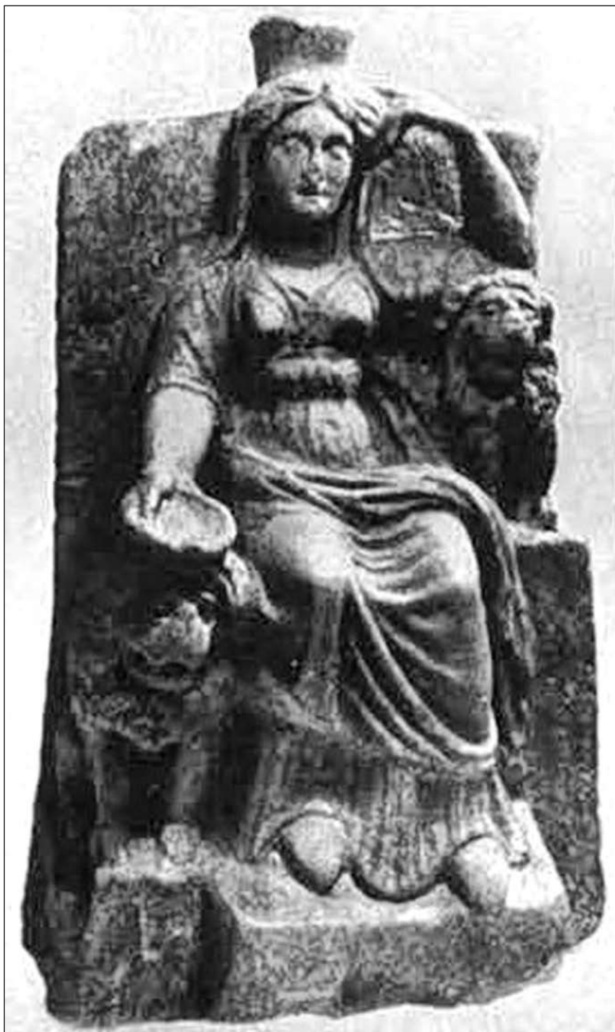
Гл. 5. Кібела з двома левами, I ст. до н. е. – II ст. н. е., Пантікапей (за СССА, VI, 579)