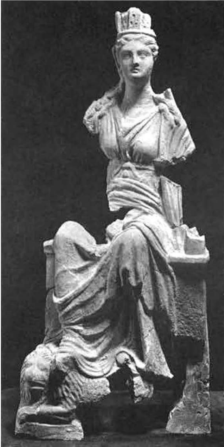
Іл. 4. Матір богів, II ст. до н. е., Мірмекій (за СССА, VI, 593)