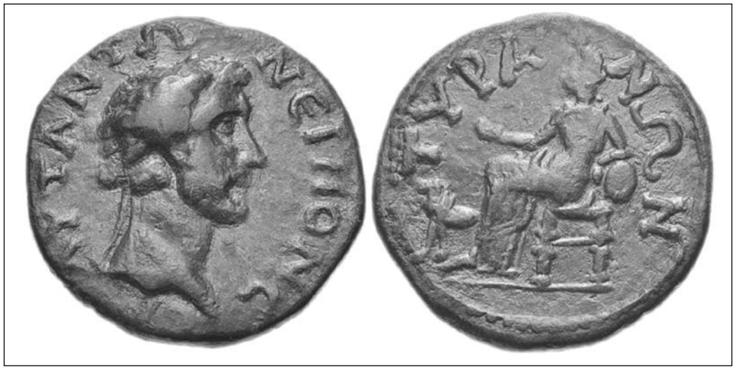
Іл. 7. Мідний тетрасарій із зображенням Кібели на троні з левами, 138–161 рр., Тіра (за Каталог-архів “Монети Тавриди: Херсонеса Таврического, Керкинитиды и городов Северо-Западного Причерноморья”, № 869–8691-2)