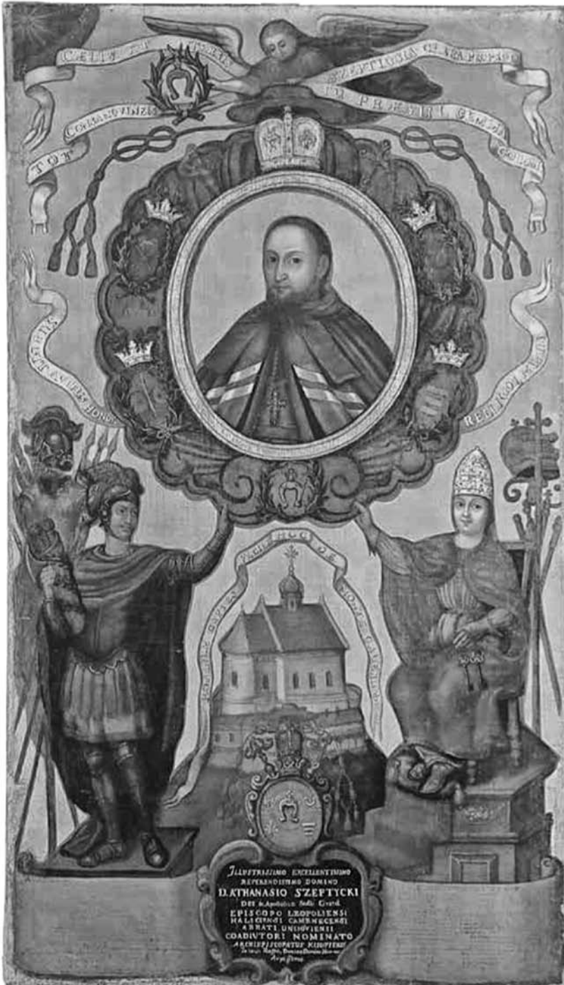
Іл. 1. Портрет-прославлення Афанасія Шептицького. 1729–1730 рр. Полотно, шовк, олія, 129×73 см. Фонди ЛМІР, Льв.Ма-1014 Ж-251.