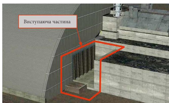
Рис. 5. Виступаюча частина об'єкта «Укриття» зі східної сторони НБК після реконструкції (варіант 2с)