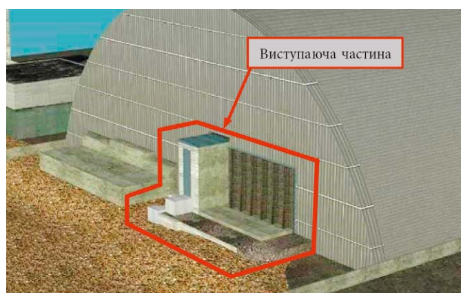
Рис. 4. Виступаюча частина об'єкта «Укриття» із західної сторони НБК після реконструкції (варіант 2з)