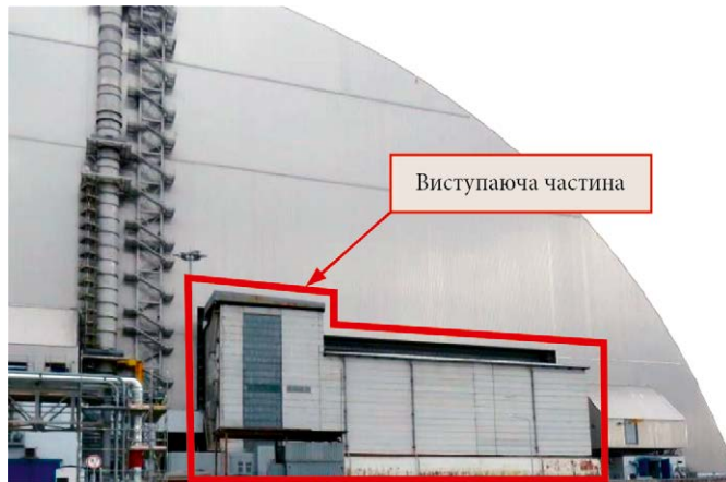
Рис. 2. Виступаюча частина об'єкта «Укриття» із західної сторони НБК

виступаючих частин об'єкта «Укриття» із західної та східної сторін НБК (рис. 2 і 3) впливають, з одного боку, ризики, які потенційно можуть виникнути в разі неконтрольованого обвалення цих споруд, зо-