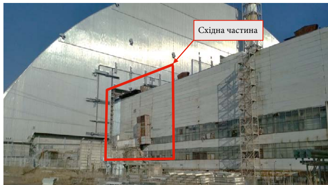
Рис. 3. Виступаюча частина об'єкта «Укриття» зі східної сторони НБК

крема радіаційні наслідки і фінансові затрати на ліквідацію самої аварії, а з іншого — ступінь залучення цих споруд для потреб поточної експлуатації системи НБК — ОУ.