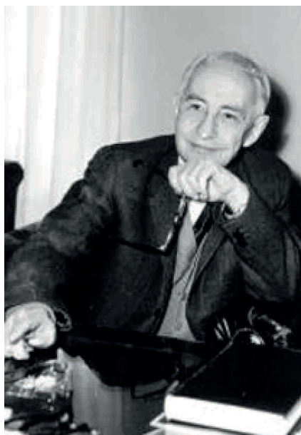
«Седой» — Кирилл Дмитриевич Синельников, академик АН Украины, директор Украинского физико-технического института, заведующий кафедрой физики плазмы