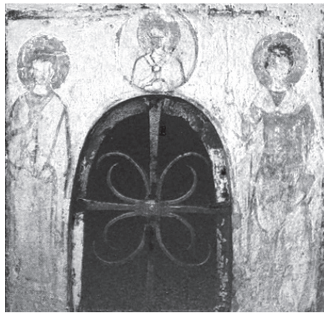
Рис. 7. Блок фресок южной стены

Вероятно, чтобы подчеркнуть важность и значимость этой особы, художник обрамляет изображение по принципу медальона. И в то же время этим приемом он несколько обособливает его от двух других, явно указывая на несколько иную ориентацию его подвижнической деятельности. Цветовое решение ближе к графическому. Двое других святых изображены во весь рост по сторонам проема окна. Сохранность здесь хуже, лики размыты. Изображение святого воина(?) прямоличное, во весь рост, правая рука поднята в знамении, левая держит щит. Одежды красочные, зеленого и коричневых тонов. Святой справа 13 изображен тоже во весь рост со свитком в левой руке, правая поднята до уровня груди. Одежды более спокойных светлых тонов.