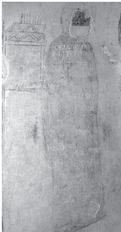
Рис. 1. Святая Евфросиния Полоцкая с моделью храма

8 Полоцк-колыбель православия на Беларуси. Календарь важнейших исторических событий за тысячу лет: 992–1992 / Сост. Лабынцев Ю. А., Толкачева Л. Л. – Минск; Полоцк, 1992. – С. 39.