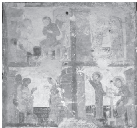
Рис. 8. Житие Евфросинии Александрийской

Первый сюжет “Явление ангела пророку Захарии” частично “самораскрылся” еще в холодную зиму 1980–1981 гг. Здание церкви отапливалось нерегулярно. Настывшие стены при нагревании начинали запотевать. В результате позднейшие записи отваливались, явив чудные цвета древних фресок. Без консервации краски несколько потускнели, потеряли свою свежесть. Однако сохранность стенописи удовлетворительная. На переднем плане почти симметрично изображены две фигуры: справа пророк Захария, слева ангел. На