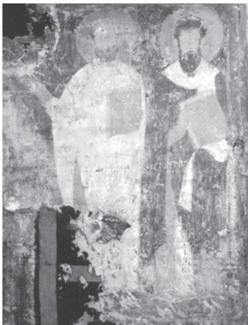
Рис. 6. Святители Иоанн Златоуст и Василий Великий

другому, благодаря абсолютно белым, до синевы одеждам Иоанна Златоуста и темно-коричневому, весомому пятну фигуры Василия Великого.