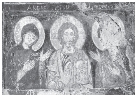
Рис. 4. Деисус. Фрагмент