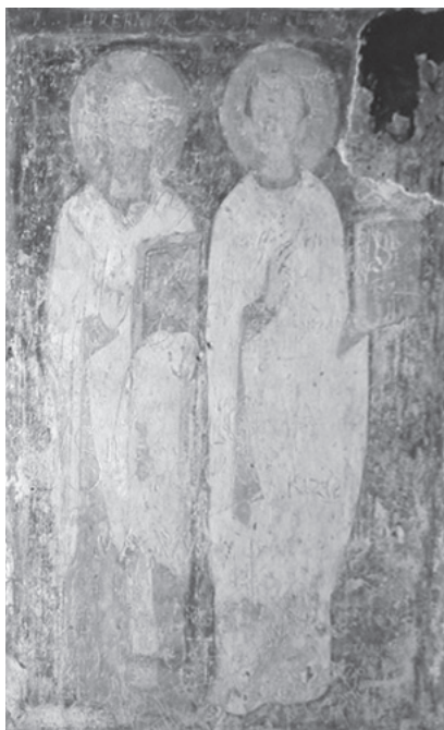
Рис. 5. Святители Григорий Богослов и Григорий Нисский