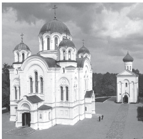
Рис. 3. Евфросиниевский монастырь в Полоцке. Вид на Спасскую церковь

Центральный регистр на восточной стене представляет одно из наиболее сохранившихся изображений семифигурного “Деисуса” в древнерусской фресковой росписи середины XII в (рис. 4). Фрагменты