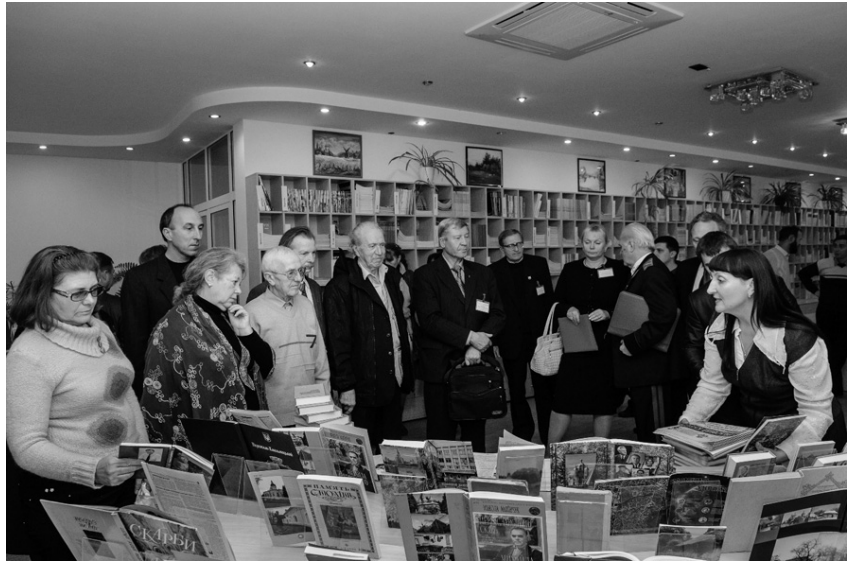
Під час книжкової виставки «Музейний зодчий України» (Автор Тарас Дудка).

Щирі вітальні слова та теплі спогади про «майстра музеїв» ще раз засвідчили виключне значення постаті Героя України Михайла Сікорського у музейній галузі України, визнання його внеску у популяризацію української народної культури, збереження історичних, духовних та культурних цінностей. Безумовним підсумком виступів учасників стало визнання того, що його відданість справі сприяла утвердженню національної свідомості українців у непростий період історії. Okремо варто вказати на те, що вплив творчого генія цієї людини на розвиток міста Переяслава-Хмельницького зробило його справжньою перлиною в когорті багатьох історичних міст та містечок України. Його творіння Національний історико-етнографічний заповідник «Переяслав» по праву називають «безцінним скарбом». Власне, такого ж права заслуговує і сам М.І. Сікорський, адже його по-справжньому подвижницький