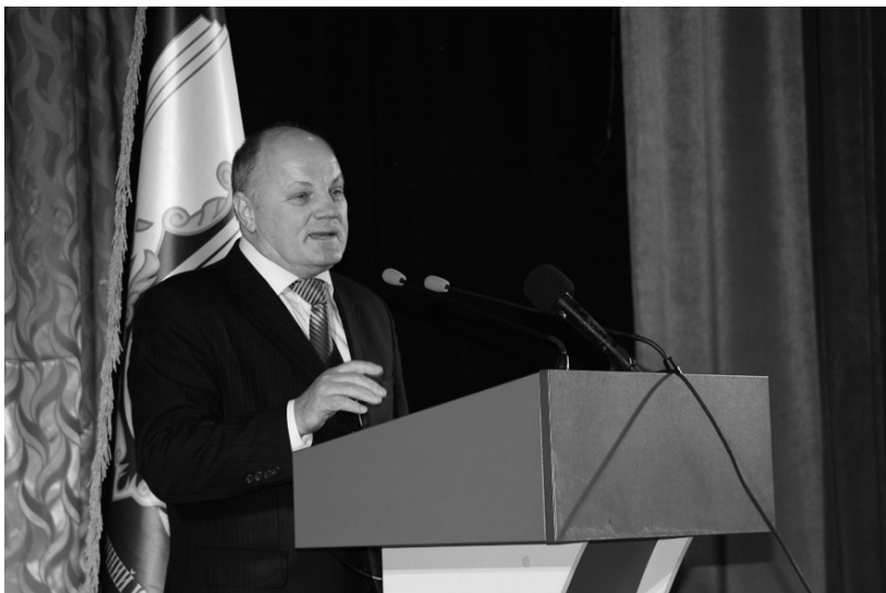
Виступ голови Національної спілки краєзнавців України Олександра Реєнта (Автор Сергій Шевченко).