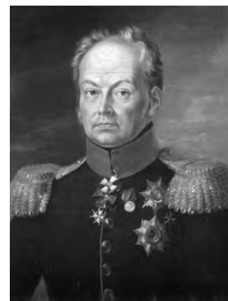
Портрет І.М. Інзова