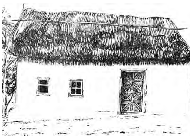
Будинок болгарина-переселенця XIX ст.

Початок болгарської колонізації до Бессарабії був пов'язаний з російсько-турецькими війнами 1768–1774 та 1787–1791 рр., під час яких на боці Росії в добровольчих військових формуваннях брали участь болгары. Після завершення цих війн частина добровольців залишилася на території Бессарабії. Зокрема, після війни 1768–1774 рр. на півдні Бессарабії, переважно в містах, поселилося близько 2 тис. болгар та гагаузів [8, с. 67]. У цей період на землях, що були зайняті російськими військами, з'являлося багато болгарських купців, ремісників та селян, які селилися в містах