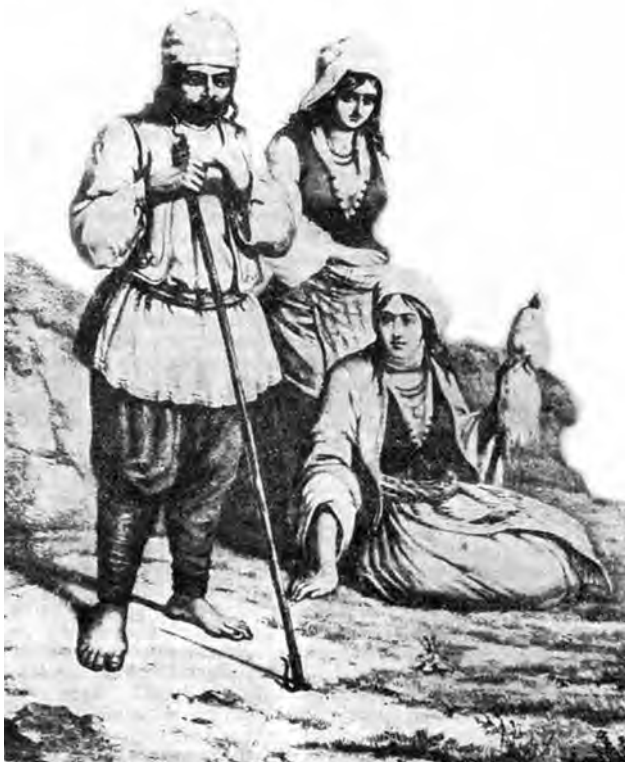
Болгари Бессарабії. 1837 р.

Чимало болгар під час колонізації переїхало до бессарабських міст. Як зазначав А.О. Скальковський, у 1819 р. кожний четвертий житель Кишинєва був болгариним [25, с. 19]. Вони зайняли частину міста, що називалася «Булгарією». В 1819 р. в Ізмаїлі проживало 404 болгарські сім'ї, в Рені – 194, в Акермані – 70, у Кілії – 18 [18, с. 20]. Після Указу 1819 р. за розпорядженням І.М. Інзова задунайським поселенцям, що проживали в містах, були надані земельні наділи під улаштування колоній. У результаті з 1820 р. розпочалося їхнє переселення з міст у нові села. Так, велика група болгар з Ізмаїла на чолі зі стариком Бано утворила в 1821 р. с. Баннівку (Болградський район). У 1822 р. кишинівські болгары (244 сім'ї) заснували с. Задунайку (Арцизький район), а група болгар з Акермана поселилася в колишньому татарському селі Ескі-Кубей, яке на честь І.М. Інзова назвали Іванівкою (с. Нова Іванівка Арцизького району).