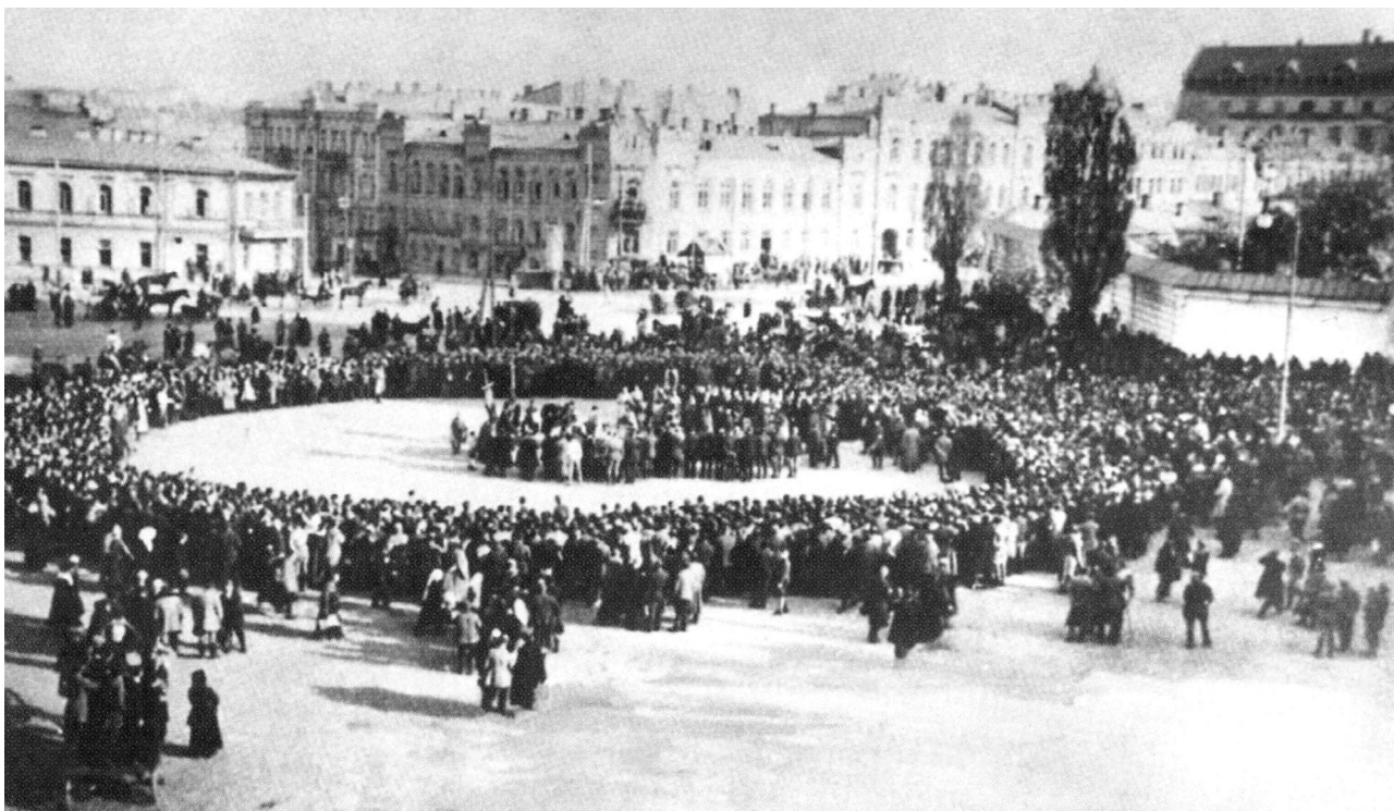
Молебен на Софійському майдані після проголошення П. Скоропадського гетьманом України

йшли у земельний фонд, що розподілявся серед неімущих категорій селян. При цьому скасовувалася приватна власність на землю, яка виводилася зі сфери товарно-грошових відносин. Остання оголошувалася загальнонародною власністю. Німецько-австрійська присутність спричинила до нової хвилі невдоволення селян. Свавільні реквізиції збіжжя провокували конфлікти з останніми. Ситуацію ускладнили добровольчі каральні загони, які, прагнучи повернути поміщицькі землі, передані селянам у користування, вдавалися до прямих розправ з ними. Зіткнення на селі набували форми громадянської війни, і до кінця ліквідувати причини, що їх породжували, гетьманському уряду так й не вдалося. Втім, це не означає, що він не надавав цій проблемі достатньої уваги.