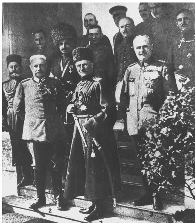
Скоропадський, Гінденбург, Людендорф й інші в німецькій головній квартирі. 1918 р.

Прагнучи, щоб українська театральна й музична культура вийшла на європейський рівень, П.Скоропадський особисто опікувався творчими колективами, які могли знайомити українську публіку з кращими зразками світового мистецтва. В травні уряд виділив 165 тис. крб. Товариству «Національний театр», ініціатором створення якого були трупа М.Садоського, «Молодий театр» Л.Курбаса і Музично-драматична школа ім. М.Лисенка. В серпні було створено Державний драматичний театр, творчий колектив якого склали відомі російські та українські актори й режисери. У жовтні на базі Національного зразкового театру, за рішенням уряду почав діяти Державний народний театр під керівництвом П.Саксаганського, в якому працювали М.Заньковецька Г.Затиркевич-Карпинська, І.Замичковський та інші видатні митці.