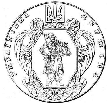
Велика печатка Української Держави