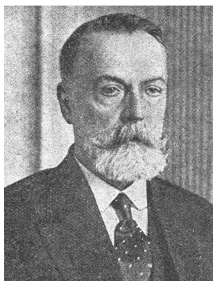
Голова Ради Міністрів Ф. Лизогуб

П.Скоропадський розпустив Центральну і Малу Ради, земельні комітети, звільнив з посад міністрів і більшість їх заступників. Реалізувати соціально-економічні реформи, а також проводити помірковану політику у культурно-освітній сфері мав новий правлячий клас. Гетьман отримав виключне право затвердження провідних посадовців владної вертикалі від прем'єра, міністрів, сенаторів до глав місцевих адміністрацій – старост. Ставлячи на перше місце ділову репутацію, адміністративний досвід, Гетьман мав враховувати й ступінь «українськості» вищого кадрового ешелону держави. Її основними критеріями виступали українське (малоросійське) етнічне походження та минула праця, територіально пов'язана з Україною.