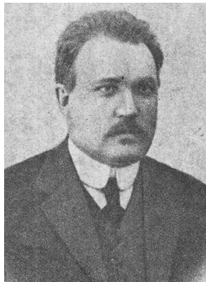
Міністр шляхів Б. Бутенко

проте чесно працював над створенням збройних сил Гетьманату. П. Скоропадський характеризував його „у всіх відносинах лицарем без страху і докору”. Хоч ліві партії й нападали на нього за відсутність виразної української політики у військовому будівництві.