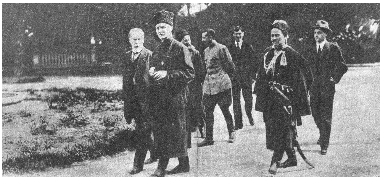
Гетьман П. Скоропадський зі своїм оточенням

Задекларована в цих актах консервативно-ліберальна ідеологія державного будівництва значною мірою увібрала в себе положення програми, створеної П. Скоропадським навесні 1918 р. політичної організації «Українська народна громада». Саме з неї були перенесені до