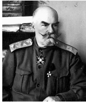
Міністр військових справ О. Рогоза

До давнього українського роду належав й міністр військових справ Олександр Рогоза – генерал-лейтенант Генерального штабу, командувач армією. Він не вирізнявся „українством”,