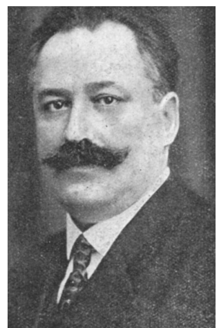
Міністр закордонних справ Д. Дорошенко