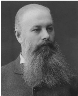
В.В. Докучаєв – керівник Полтавської експедиції

на біологічному факторі ґрунтоутворення, на ролі в цьому процесі живої речовини та продуктів її життєдіяльності. Потрібно відзначити й те, що всі зібрані на Полтавщині матеріали лягли в основу низки наукових праць В.І. Вернадського, присвячених ґрунто-геологічному аналізу Кременчуцького повіту. Ці матеріали також використав і В.В. Докучаєв для написання славнозвісної книги „Наші степи колись тепер”. Володимир Іванович разом з іншими учасниками ґрунтослідної експедиції, керованої В.В. Докучаєвим, приймав участь у складанні першої у Росії та у світі 10-верстної карти ґрунтів Полтавської губернії [3].