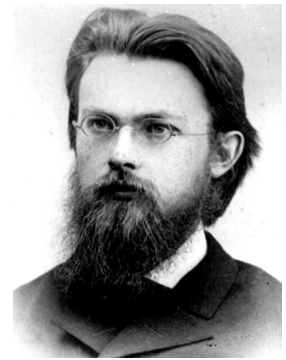
Так виглядав В.І. Вернадський, коли почав працювати у Полтавській експедиції В.В. Докучаєва

позначає на карті так звані могили та кам'яні „баби” – древні скульптури бронзової епохи, робить археологічні розкопки та описування. До речі, кам'яні „баби”, які експонуються у Полтавському краєзнавчому музеї, привезені сюди якраз Володимиром Івановичем із Кременчуцького повіту. Його захоплення археологією проявилось і на Лубенщині, де він біля села Гінці зробив розкопки палеолітичної стоянки прадавньої людини. Це була рідкісна робота, яку вельми цінував В.В. Докучаєв [3].