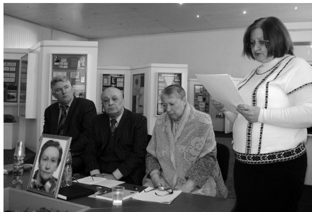
Краєзнавча конференція. 29.03.2013 р.