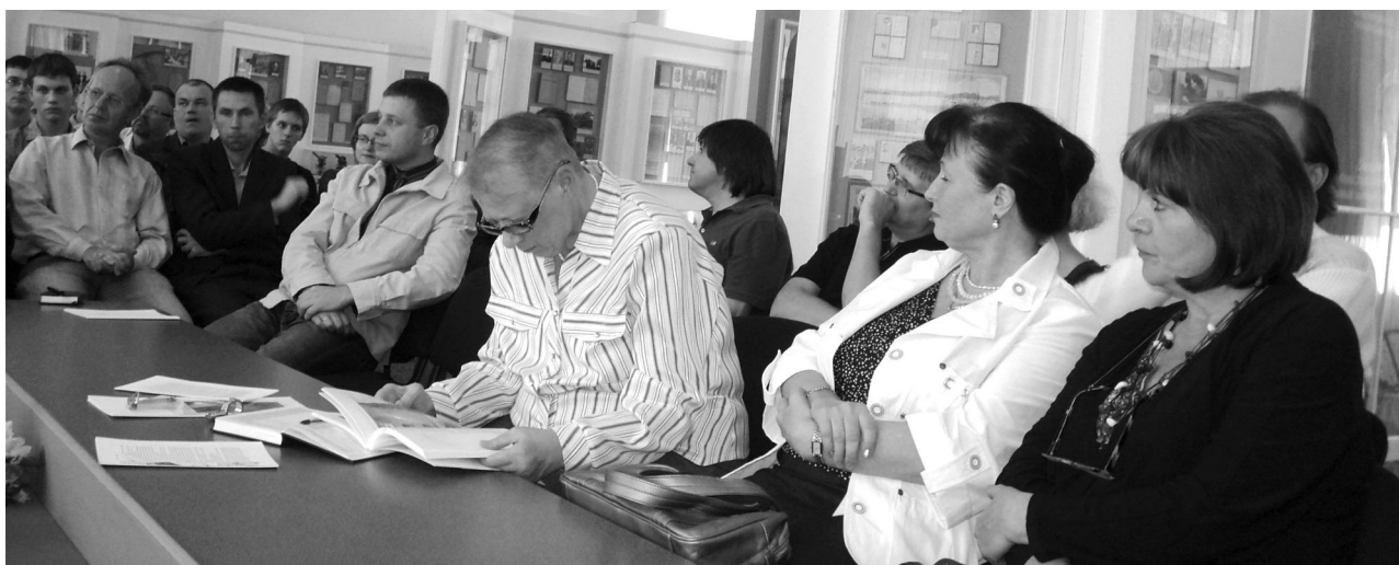
Засідання історико-краєзнавчого клубу «Грані». 20.09.2012 р.

Задля акумуляції зусиль дослідників у вивченні історії Придніпров'я керівництво ІГП ініціювало проведення щорічних регіональних краєзнавчих конференцій. Перша з них «Дослідники Придніпров'я ХІХ–ХХ ст.» відбулась у березні 2002 року. Частину матеріалів конференції було вміщено у 14-му номері «Гуманітарного журналу». У 2003 р. відбулась наступна конференція на тему «Пам'ятки історії і культури Придніпров'я», матеріали якої склали частину 17-го номеру журналу [5, с.148]. З кожним роком краєзнавча конференція, яка проводиться ІГП спільно з Дніпропетровською обласною організацією Національної спілки краєзнавців України набувала популярності серед дослідників. Тематика конференцій різноманітна: життя і діяльність видатних особистостей, проблемні питання історії міст і сіл, збереження історико-культурної спадщини та інші. Зазвичай під час роботи конференції розглядається вузьке коло питань, пов'язаних із визначеною темою. Однак тричі конференція присвячувалась помітним