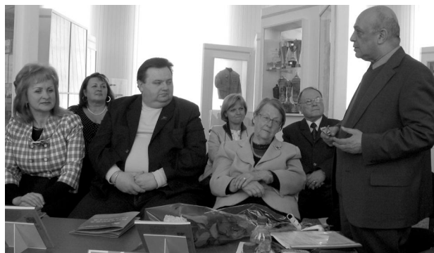
Засідання історико-краєзнавчого клубу «Грані». 24.04.2009 р.