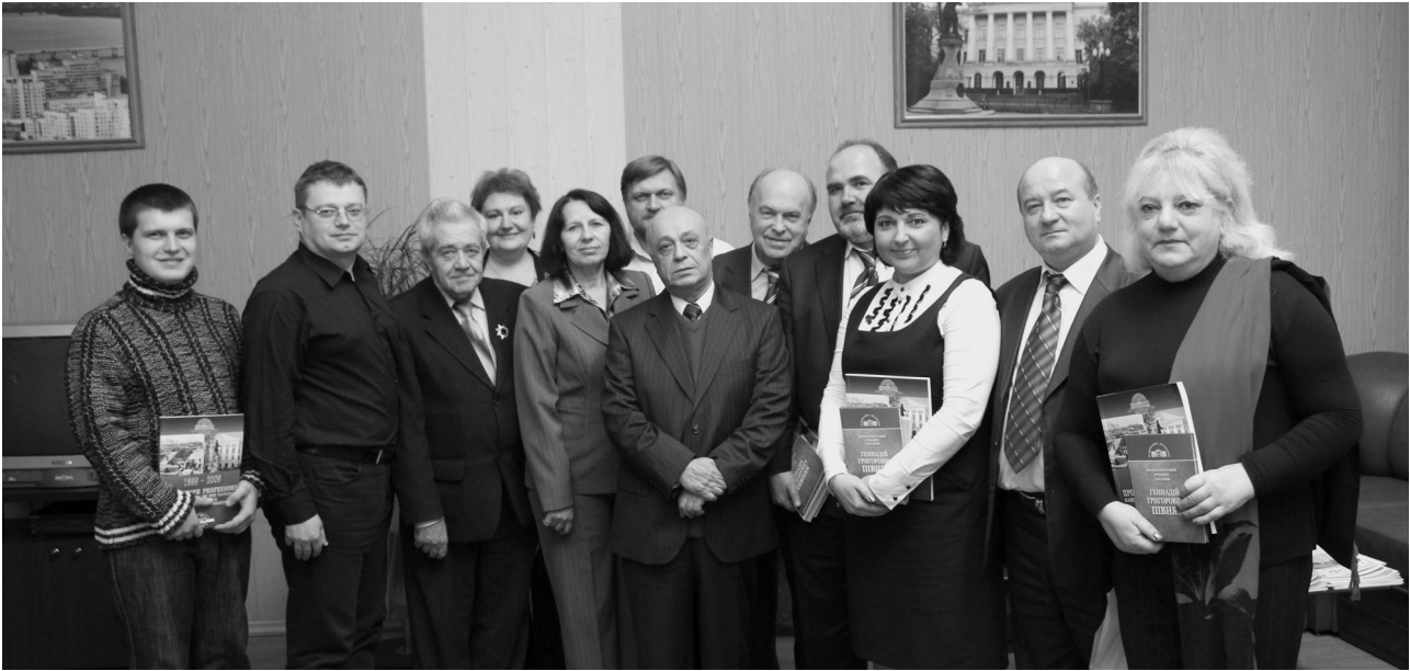
Учасники Тронецьких читань в НГУ. 19.11.2010 р.