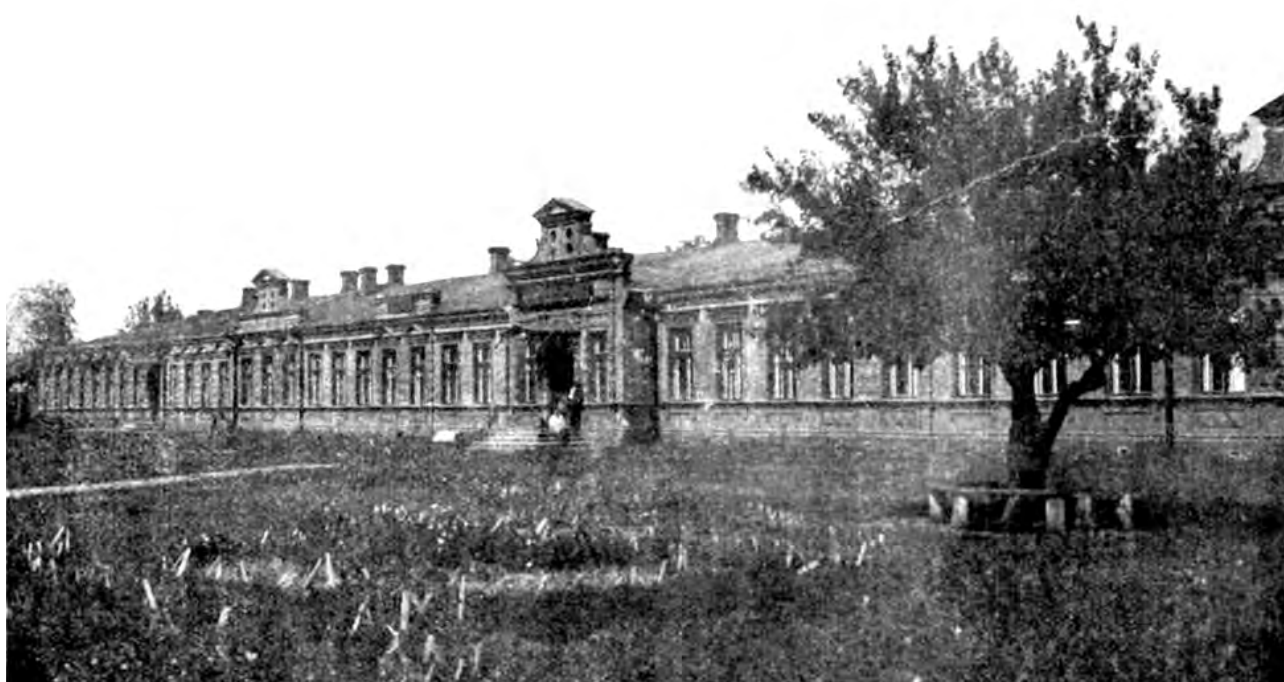
Старий будинок комерційного училища в Катеринославі, де відбувалися перші засідання Катеринославської вченої архівної комісії.

На основі вивчення знайдених джерельних матеріалів співробітники Комісії готували