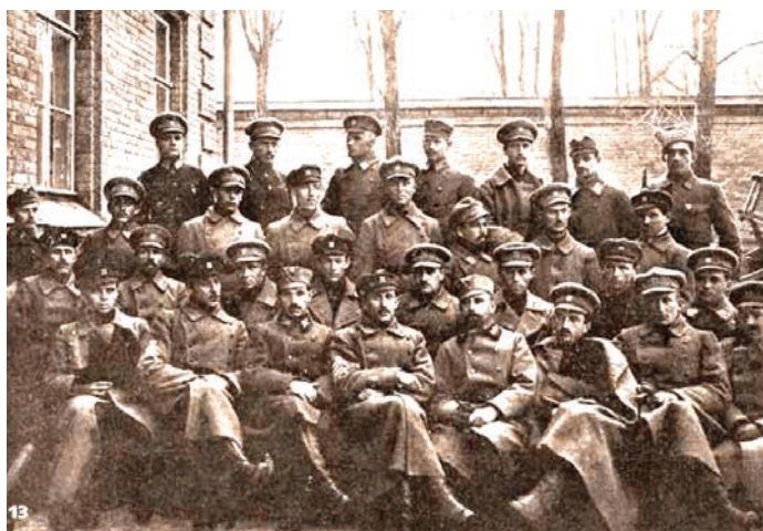
13 Київське формування січових стрільців (в центрі – Є.Коновалець).