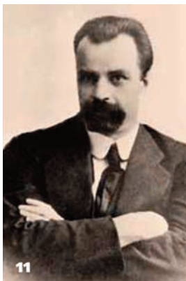
11 Володимир Винниченко – голова Генерального секретаріату УЦР. 1917 р.