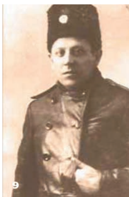
9 Симон Петлюра – делегат Всеукраїнських військових з'їздів у Києві. 1917 р.