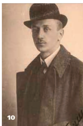
10 Петро Чикаленко – секретар українського посольства в Стамбулі. 1919 р.