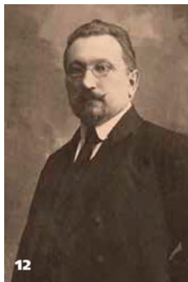
12 Андрій Ливицький – голова дипломатичної місії УНР у Польщі. 1920 р.