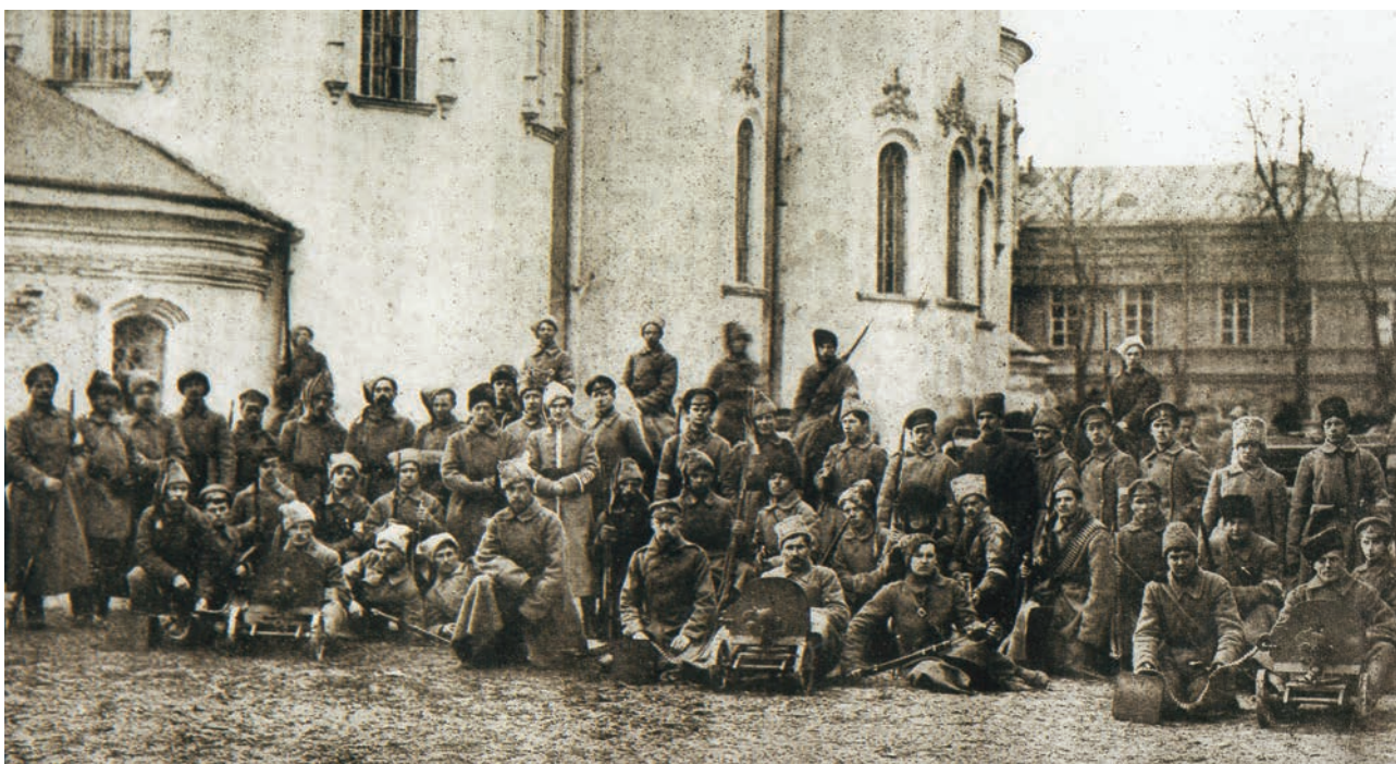
Гайдамацький кіш Слобідської України (в центрі С.Петлюра). 1918 р.