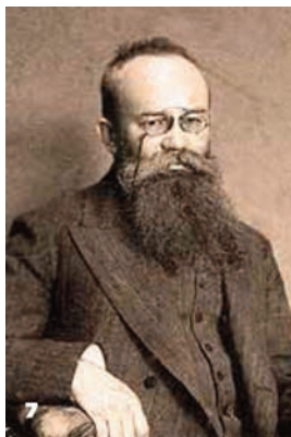
7 Михайло Грушевський – голова Української Центральної Ради. Львів, до 1917 р.