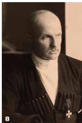
8 Павло Скоропадський Гетьман Української Держави. 1918 р.